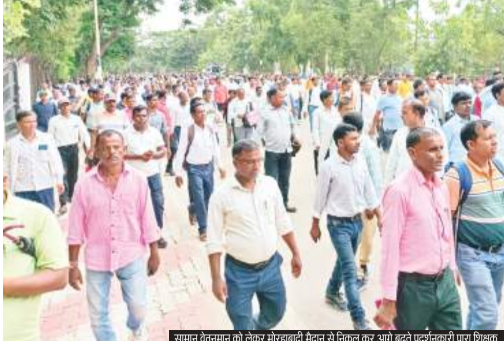
सामान वेतनमान को लेकर मोरहाबादी मैदान से निकल कर आगे बढ़ते प्रदर्शनकारी पारा शिक्षक.