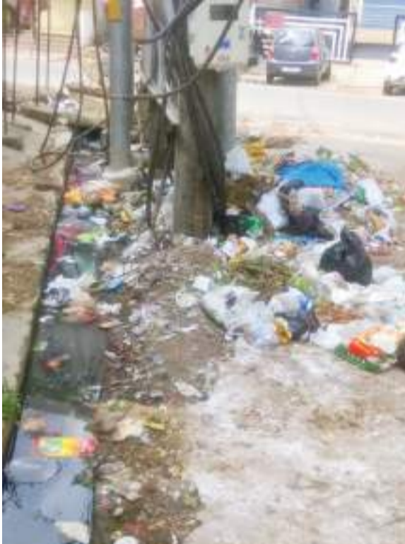
ओल्ड लोअर बाजार रोड के मुहाने पर जमा कचरे का ढेर.