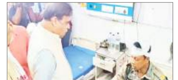
रिम्स में घायल सहायक पुलिसकर्मी से मिलते हिमंता।

असम के सीएम हिमंता बिस्व सरमा शनिवार को सुबह रिम्स पहुंचे, वहां उन्होंने सहायक पुलिसकर्मियों से मुलाकात की। हिमंता ने रिम्स में धर्ती सहायक पुलिसकर्मियों से घटना की पूरी जानकारी ली। इसके बाद मीडिया से बातचीत में हिमंता बिस्व सरमा ने कहा कि लोकसभा चुनाव के समय से ही झारखंड में ऐसा माहौल देखा जा रहा है। झारखंड में स्थिति बिगड़ती जा रही है। यहां स्थिति को सुधारने की जरूरत है। कभी इस प्रदेश में फिलिस्तीन का झंडा लहराया जा रहा है, तो कभी राजनवत के जुलूस पर पाबंदी लगायी जा रही है, वहाँ मुहरम का जुलूस निकालने का परमिशन दिया जा रहा है, उनके साथ अमर बाउरी भी मौजूद थे।