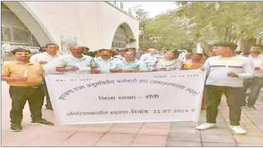
समाहरणालय कर्मी शनिवार को कैडल मार्च निकालते हुए।

बात दें इससे पूर्व समाहरणालय कर्मियों ने रांची डीसी को ज्ञापन सौंपा था। समाहरणालय कर्मी अपनी नौ सूत्री मांगों को लेकर वीते