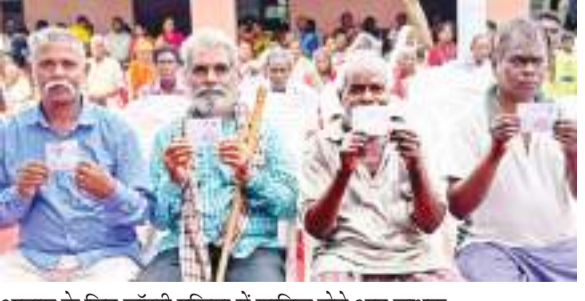
आवास के लिए लॉटरी प्रक्रिया में शामिल होने आए लाभुक.

प्रधानमंत्री आवास योजना (शहरी) के तृतीय घटक के अंतर्गत धुर्वा के आनी गांव में कुष्ठ रोगियों को एक ही स्थान में बसाने के लिए 256 आवासों का निर्माण किया गया है। निगम द्वारा लॉटरी के माध्यम से शनिवार को 250 परिवारों को आनी गांव में आवास आवंटित किए गए। लाभुकों में इंदिरा नगर, निर्मला कॉलोनी व तपोवन मंदिर के पास रहने वाले लोग शामिल हैं। अपर प्रशासक के नेतृत्व में इंदिरा नगर, निर्मला आश्रम व तपोवन मंदिर के पास निगम की टीम ने पहुंच कर योग्य लाभुकों के बीच आवासों की लॉटरी की प्रक्रिया पूरी की। इसक्रम में इंदिरा नगर में 182, निर्मला कॉलोनी में 48 तथा तपोवन मंदिर परिसर में लॉटरी कर 20 लाभुकों को आवास