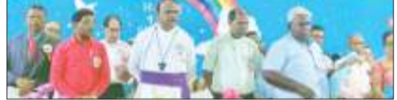
संत मारग्रेट बालिका उच्च विद्यालय।