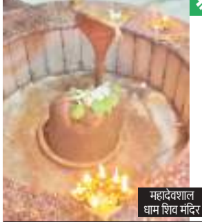
महादेवशाल धाम शिव मंदिर

सावन माह की पहली सोमवारी 22 जुलाई को है। सावन में शिवालयों में पूजा-अर्चना के लिए श्रद्धालुओं की भीड़ उमड़ती है। कोल्हान में भी कई ऐसे प्राचीन शिवालय हैं जो पूरे झारखंड व देश में विख्यात हैं। पश्चिमी सिंहभूम जिले के गोईलकेरा प्रखंड के महादेवशाल धाम भी झारखंड के दूसरे बाबा धाम के नाम से जाना जाता है। महादेवशाल धाम पहाड़ों के बीच बसा है। सुंदर मनोरम पहाड़ियों के किनारे स्थित महादेवशाल धाम में रोजाना श्रद्धालु पूजा अर्चना के लिए पहुंचते हैं, लेकिन सावन माह में यहां श्रद्धालुओं की भीड़ उमड़ती है। यहां खंडित शिवलिंग की वर्षों से पूजा की