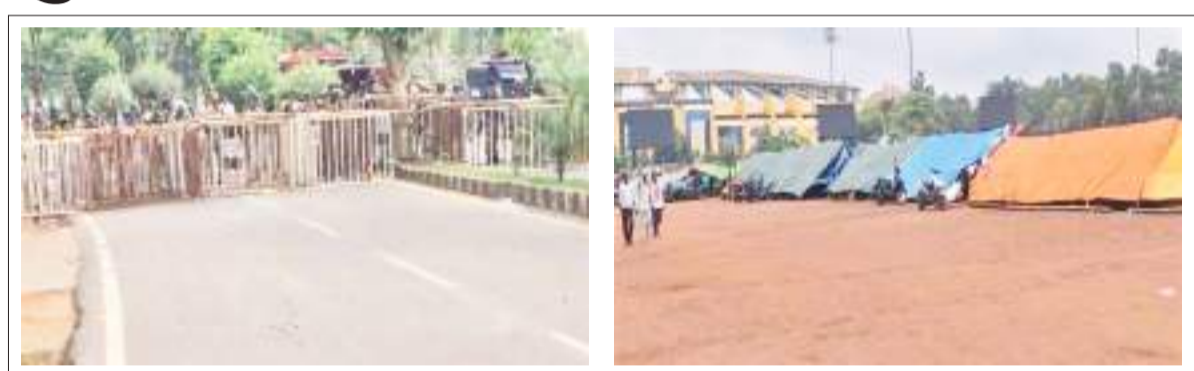
राजधानी रांची के मोरहाबादी जानेवाले सभी रास्ते में बैरिकेडिंग कर भारी संख्या में पुलिस के जवान तैनात किए गए। तंबू में जमे हैं सहायक पुलिसकर्मी।