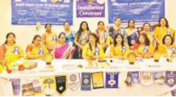
पदस्थापन समारोह में मौजूद इनरव्हील क्लब ऑफ रांची साउथ की पदाधिकारी।