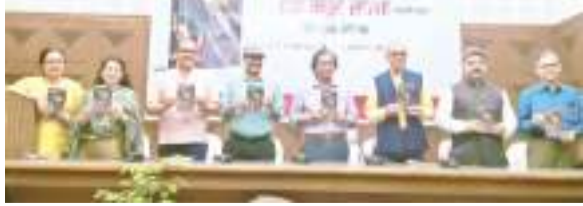
'एक मधुर सपना' के लोकार्पण समारोह में गणमान्य साहित्यकार।