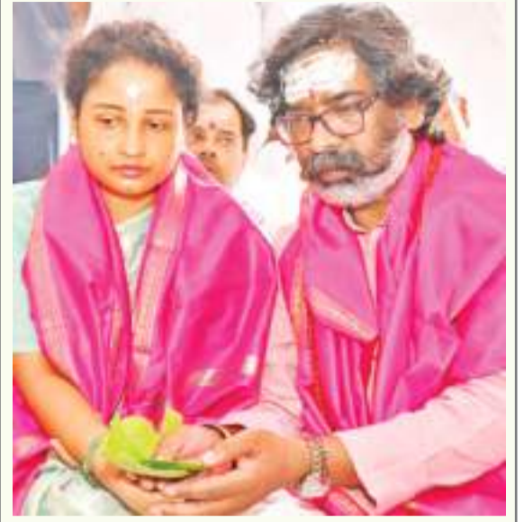
सीएम हेमंत सोरेन और कल्पना सोरेन ने शनिवार को देवघर मंदिर में पूजा-अर्चना की। राज्य की मंगल कामना की।