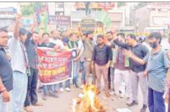
अलबर्ट एक्का चौक पर पुतला दहन करते आजसू कार्यकर्ता.

आजसू के पदाधिकारियों ने कहा कि आज लोगों को घर से निकलने में डर लगता है. छिनैती समेत अन्य आपराधिक घटनाओं में अप्रत्याशित वृद्धि हुई है. अपराधी बेखौफ होकर घटनाओं को अंजाम दे रहे हैं उनके अंदर कानून का भय खत्म हो गया है. बीती रात ही हरमू में एक बैंककर्मी की अपराधियों ने गोली मारकर निरमं हत्या कर दी. ऐसी कई घटनाएं राज्यभर में आए दिन हो रही हैं.