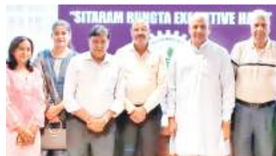
चैंबर भवन में आयोजित बैठक में मौजूद पदाधिकारी.

लघु उद्योग भारती के अखिल भारतीय संगठन मंत्री प्रकाश चंद के रांची आगमन पर बुधवार को चैंबर भवन में लघु उद्योग भारती और झारखंड चैंबर ऑफ कॉमर्स की संयुक्त बैठक हुई. बैठक में शामिल उद्यमी प्रतिनिधियों ने विभिन्न समस्याओं और चुनौतियों को सभा के समक्ष रखा. मूल रूप से झारखंड से जुड़े मुद्दों की चर्चा हुई यथा- उद्योग व्यापार के लिये भूमि की अनुपलब्धता, एसटी-एससी भूमि के औद्योगिक उपयोग में आनावाली बाधा, बैंकों द्वारा वित्तीय पोषण में उदासीनता एवं कानून व्यवस्था की लचर स्थिति पर विशेष जोर दिया गया. उद्यमियों ने उद्योग से जुड़े कानून और नियमों को सरल बनाने, सूक्ष्म उद्यमियों के वित्तीय पोषण को सरल बनाने जैसे विषयों की चर्चा की. इसके अलावा ईज ऑफ डूइंग बिजनेस को सरलीकृत करने, साइबर क्राइम के अनुसंधान के लिये