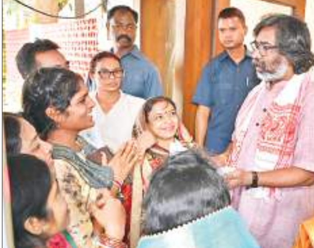
सीएम हेमंत सोरेन से मिलती महिला फरियादी।

रांची। मुख्यमंत्री हेमंत सोरेन से बुधवार को उनके कांके रोड स्थित आवासीय कार्यालय में विभिन्न स्थानों से आए लोगों ने मुलाकात की। लोगों ने अपनी-अपनी समस्याओं से मुख्यमंत्री को कराया। मुख्यमंत्री ने कहा कि यह आपकी सरकार है। हमारी सरकार पूरी संवेदनशीलता के साथ जनता के हित में लगातार कार्य करती आ रही है। उन्होंने लोगों को भरोसा दिया कि आपकी समस्याओं का यथोचित एवं त्वरित समाधान होगा। इस दौरान हेमंत सोरेन को पुनः मुख्यमंत्री का दायित्व संभालने पर लोगों ने बधाई भी दी।