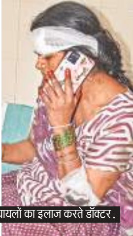
घायलों का इलाज करते डॉक्टर.