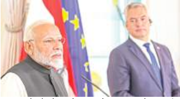
प्रधानमंत्री नरेंद्र मोदी के साथ के ऑस्ट्रिया के चांसलर कार्ल नेहमर