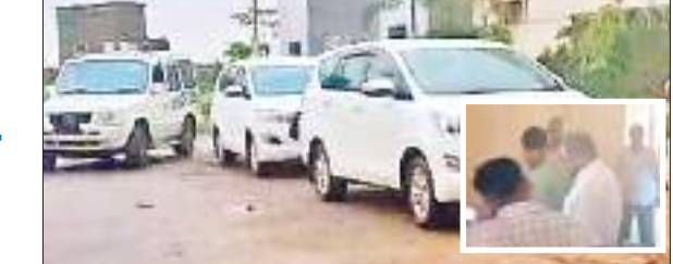
कांके रिसोर्ट के बाहर ईडी टीम की कार और ब्लॉक में जांच करते अधिकारी।