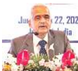
गवर्नर शक्तिकांत दास।

भारतीय रिजर्व बैंक (आरबीआई) गवर्नर शक्तिकांत दास ने गुरुवार को कहा कि असुरक्षित कर्ज पर कार्रवाई नहीं करने से बड़ी समस्या पैदा हो सकती है। उन्होंने कहा कि इस तरह की गतिविधियों पर आरबीआई की कार्रवाई से असुरक्षित कर्ज में वृद्धि धीमी होने का वांछित प्रभाव पड़ेगा। यहां आरबीआई के कॉलेज ऑफ सुपरवाइजर्स में वित्तीय मजबूती पर एक अंतरराष्ट्रीय सम्मेलन को संबोधित करते हुए दास ने कहा कि असुरक्षित ऋण पर प्रतिबंध इस दृष्टिकोण का परिणाम है कि असुरक्षित कर्ज में वृद्धि के कारण इस बाजार में संभावित समस्या हो सकती है। उन्होंने कहा कि कुल मिलाकर मुख्य मानदंड अच्छे दिख रहे हैं, लेकिन मानकों में ढील, उचित मूल्यांकन का अभाव और कुछ