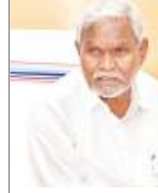
समीक्षा बैठक में अफसरों को निर्देश देते सीएम चंपाई सोरेन।

किसानों का दो लाख रुपये तक का ऋण माफ किया जाएगा