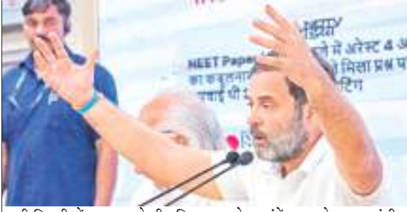
नयी दिल्ली में गुरुवार को नीट विवाद पर प्रेस कॉन्फ्रेंस करते राहुल गांधी.

कांग्रेस सांसद राहुल गांधी ने यूजीसी-नेट और नीट-यूजी की परीक्षाओं में कथित पेपर लीक के मुद्दे को लेकर सरकार पर निशाना साधा और आरोप लगाया कि पीएम नरेंद्र मोदी पेपर लीक को रोक नहीं पा रहे या फिर रोकना नहीं चाहते. उन्होंने यह दावा भी किया कि शिक्षण संस्थाओं पर भाजपा और आरएसएस से जुड़े लोगों ने कब्जा कर लिया है और जब तक इस स्थिति को बदला नहीं जाता तब तक पेपर लीक होना बंद नहीं होगा. राहुल गांधी ने संवाददाताओं से कहा कि विपक्ष संसद के आगामी सत्र में इस मुद्दे को उठाएगा. राहुल ने दावा किया कि युवाओं के भविष्य से खिलवाड़ किया जा रहा है. कांग्रेस नेता ने कहा, मामले की जांच की जा रही है. कोई न कोई जिम्मेदार है. उसे पकड़ा जाना चाहिए. प्रवेश परीक्षा नीट को लेकर उपजे विवाद के बीच, शिक्षा मंत्रालय ने राष्ट्रीय परीक्षा एजेंसी (एनटीए) द्वारा आयोजित यूजीसी-नेट परीक्षा रद्द करने का बुधवार को आदेश