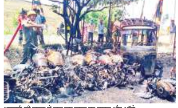
अगलगी की घटना में जल कर खाक हुए बाइक और ऑटो।