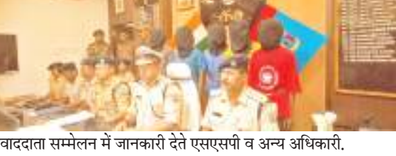
संवाददाता सम्मेलन में जानकारी देते एसएसपी व अन्य अधिकारी