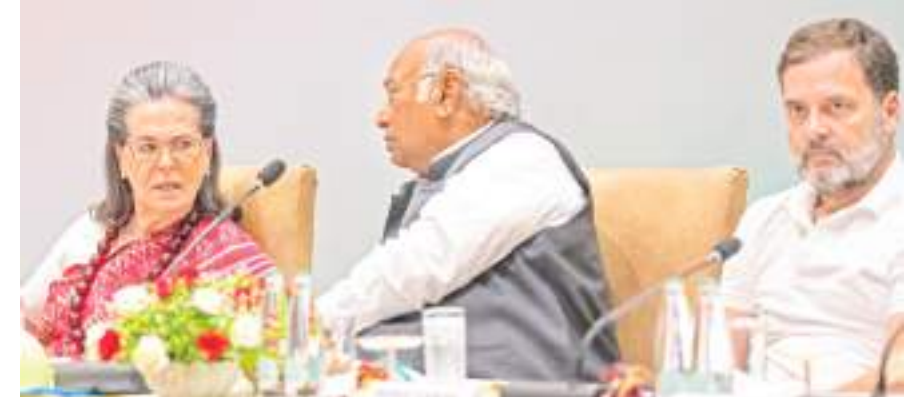
कांग्रेस संसदीय दल की बैठक में पार्टी अध्यक्ष मल्लिकार्जुन खरगे, सोनिया गांधी और राहुल गांधी।