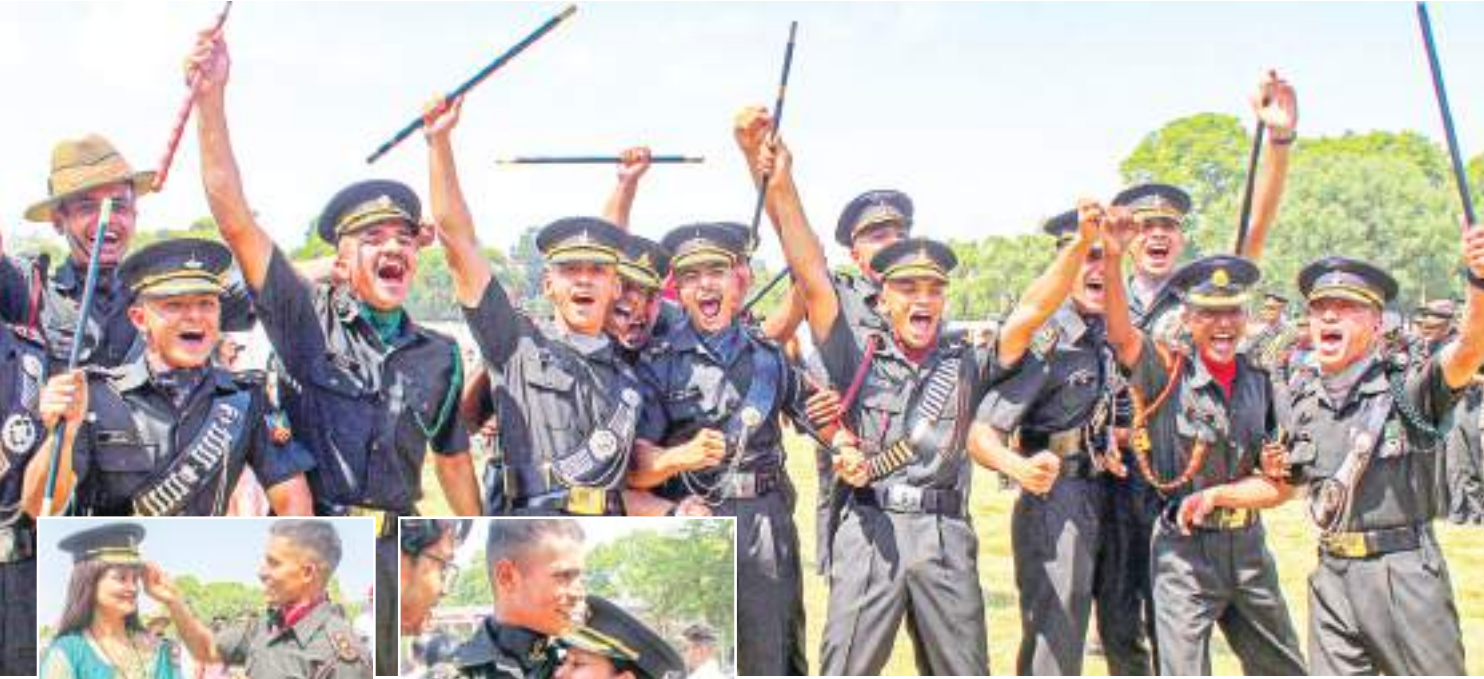
देहरादून। देहरादून में शनिवार को भारतीय सैन्य अकादमी में पांसिंग आउट परेड के बाद जश्न मनाते नवनि्युक्त अधिकारी और अपने परिवार के साथ एक नवनि्युक्त अधिकारी।