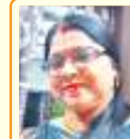
मंजू धारण 'मंगुल'

मां धूप में शीतल छाया है हमारी मिट्टी का सरगमया है ये दर ब्रह्मांड है जो बच्चे के पहले श्रद्धा में समाया है मां वो सीप होती है जिसमें मासूम सी मिट्टी सीती है हमारा तीर्थों से कहीं बेहतर मां की बंदगी होती है। मां ईश्वर का वरदान है उसके बिना जीवन वीरान है जिसके पास मां की दीवार है वो तो सबसे बड़ा धनवान है मां मान है, सम्मान है ईसायित की पखान है मां बच्चों के लिए उनका मुकम्मल सुंदर ज्ञान है। मां तेरी - मेरी, इसकी - उसकी, सब कसकी होती है दीया बन जलती है जो तारावो ऐसी आति होती है।