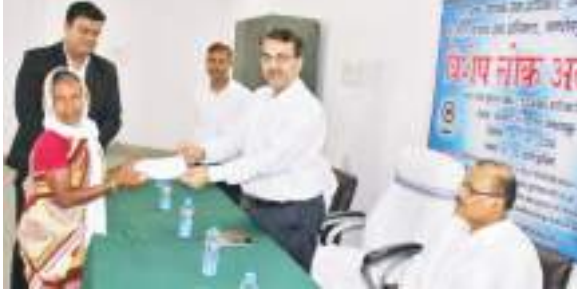
मुख्य संवाददाता। जमशेदपुर

झारखंड राज्य विधिक सेवा प्राधिकार (झालसा) के तत्वावधान में शनिवार को जिला विधिक सेवा प्राधिकार (डालसा) जमशेदपुर की ओर से मोटर वाहन दुर्घटना दावा से जुड़ी विशेष लोक अदालत का आयोजन किया गया। इसमें 42 मामलों का निष्पादन किया गया। साथ ही 2 करोड़ 64 लाख 04 हजार 984 रुपये मोटर वाहन दुर्घटना दावा के तहत विभिन्न लाभार्थियों के बीच वितरित किया गया।