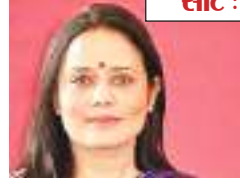
महुआ मोइत्रा टीएमसी