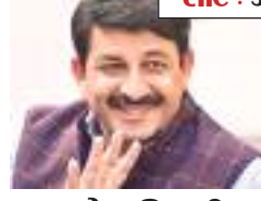
मनोज तिवारी भाजपा