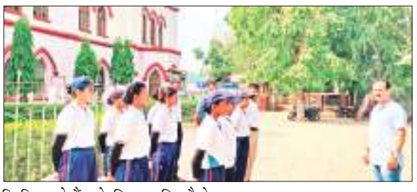
रिपब्लिक डे कैंप के लिए चयनित कैडेट्स।

संत कोलंबस कॉलेज के 13 एनसीसी कैडेटों का गणतंत्र दिवस परेड शिविर के पहले चरण हेतु चयन हुआ है। इस शिविर में हजारीबाग ग्रुप कुल 400 कैडेट्स ने भाग ले रहे हैं, जिनमें अच्छे कैडेटों का चयन आगे के चरणों के लिए होगा। बताते चलें कि हर वर्ष एनसीसी 12948 से रिपब्लिक डे कैंप परेड में हिस्सा लेता रहा है, जिसकी तैयारी हर डायरेक्टरेट छह माह पूर्व ही शुरू करता है। कैडेट्स इस दौरान ड्रिल, कल्चरल की तैयारी करके दिल्ली परेड में हिस्सा लेते हैं। कैडेट्स इस दौरान विभिन्न प्रतियोगिताओं में भाग