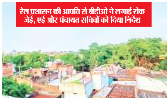
रेल प्रशासन की आपत्ति से बीडीओ ने लगाई रोक जेई, एई और पंचायत सचिवों को दिया निर्देश

सभी पंचायत सचिव जेई और एई को भी निर्देश दिया गया है कि सभी 18 पंचायतों में स्टैटमेंट बनाने के पहले जांच करेंगे कि रेल क्षेत्र में है या नहीं। अगर रेल क्षेत्र में पड़ता है तो वहां पर कार्य नहीं करना है। इसके बाद ही