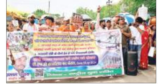
राष्ट्रीय युवा शक्ति के सदस्य सड़क पर उतर कर प्रदर्शन करते हुए।

लोगों को पानी के इंटरजार में रात दिन जागना पड़ रहा है। डैम से लोगों तक सप्लाई पानी पहुंचाया जा रहा है। लेकिन यह पानी पीने योग्य नहीं रहता है। इसके साथ ही सप्लाई पानी आने जाने का कोई समय नहीं रहता है। जुड़को द्वारा दर्जनों स्थानों पर पानी की बड़ी-बड़ी टंकी बनाई