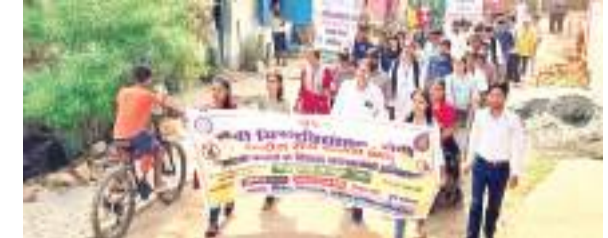
नशे के खिलाफ जागरूकता रैली निकालते एनएसएस के स्वयंसेवक।