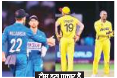
टीम इस प्रकार है

तारोबा. टी20 विश्व कप से बाहर हुई न्यूजीलैंड की टीम अब युगांडा के खिलाफ होने वाले ग्रुप सी के तीसरे मुकाबले में जीत की उम्मीद लगाये होगी। अफगानिस्तान ने यहां पापुआ न्यू गिनी पर जीत से न्यूजीलैंड को ग्रुप से सुपर आठ की दौड़ से बाहर कर दिया। अब ग्रुप में न्यूजीलैंड के दो मैच बचे हैं जिनके नतीजा मानने नहीं रखेगा। न्यूजीलैंड की टीम एक दशक में पहली बार विश्व कप (वनडे और टी20 प्रारूप) के ग्रुप चरण से आगे बढ़ने में सफल रही। अब उम्रदराज खिलाड़ियों से भरी न्यूजीलैंड की टीम उम्मीद करेगी कि वह नयी टीम युगांडा और पापुआ न्यू गिनी पर जीत दर्ज कर स्वदेश लौटे।