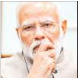
हो लेकिन एनडीए के अन्य घटक दलों की मदद से नरेंद्र मोदी तीसरी बार सरकार बनाने में सफल हो गए। इस बार के लोकसभा चुनाव के दौरान भी पीएम मोदी ने बिहार का

रिक्ॉर्ड दौरा किया। उन्होंने आठों चरणों के चुनाव के दौरान बिहार के कई लोकसभा सीटों पर चुनाव प्रचार किया। वहीं पटना में रॉड शो भी किया। हालांकि लोकसभा चुनाव परिणाम भाजपा के उम्मीदों के