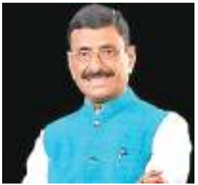
संजय सेठ, केंद्रीय रक्षा राज्यमंत्री.

रांची संसदीय निर्वाचन क्षेत्र से लगातार दूसरी बार चुनाव जीत कर संजय सेठ केंद्रीय मंत्रीमंडल में अपनी जगह बनाने में सफल रहे हैं. मोदी सरकार के तीसरे कार्यकाल में उन्हें रक्षा राज्य मंत्री बनाया गया है. सांसद के केंद्रीय मंत्री बनने पर इंचांगड विधानसभा क्षेत्र में खुशी का माहौल है. सबसे अधिक खुशी चांडिल डैम के विस्थापितों में देखी जा रही है. चांडिल डैम के कई विस्थापित परिवार बगैर संपूर्ण मुआवजा व पुनर्वास सुविधा के