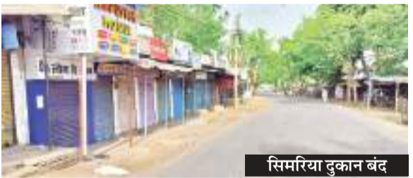
सिमरिया दुकान बंद

सिमरिया अनुमंडल मुख्यालय की दुकानें और अन्य व्यावसायिक प्रतिष्ठान शुक्रवार को दिनभर बंद रहे. सुबह से लेकर शाम तक दुकानों के बंद रहने से लोगों को परेशानियों का सामना करना पड़ा. बंदी को सफल बनाने के लिए गुरुवार की देर रात दुकानदारों ने मशाल जुलूस की निकाला था. सुनिंद डेमिकल दुकानों को छोड़कर ठेला खोमपा से लेकर बड़े-बड़े व्यावसायिक प्रतिष्ठानों में ताला लटका रहा. दरअसल, सिमरिया अंचल अधिकारी ने एक सप्ताह पहले संबंधित दुकानों को अपने दुकानों के आगे से अतिक्रमण हटाने के लिए नोटिस दिया था. अतिक्रमण में तौड़ने