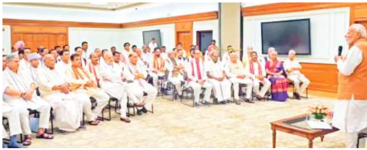
प्रधानमंत्री नरेंद्र मोदी एनडीए नेताओं के साथ बातचीत के दौरान।

नरेंद्र मोदी ने रविवार को लगातार तीन बार पीएम पद की शपथ से पूर्व अपने नए मंत्रिमंडल के नेताओं से चाय पर चर्चा की। इसे लेकर नरेंद्र मोदी के घर पर एनडीए नेताओं की एक बैठक हुई। इस दौरान उन्होंने अपने नए मंत्रियों को मंत्र दिया, उन्होंने कहा कि परियोजनाओं को समय पर पूरा करें। शपथ ग्रहण समारोह से पहले चाय पर भाजपा नेताओं से मुलाकात करते हुए प्रधानमंत्री नरेंद्र मोदी ने संभावित मंत्रियों को स्पष्ट निर्देश दिया कि वे शासन पर ध्यान दें और 100 दिन के रोडमैप को जमीन पर उतारें। उन्होंने कहा कि सभी लोग परियोजनाओं को समय पर पूरा करें, बता दें, कैबिनेट गठन से पहले पीएम मोदी हर बार चाय पर भाजपा नेताओं से मुलाकात करते हैं। साल 2014 में भी ऐसी ही बैठक आयोजित हुई थी, अब नरेंद्र मोदी ने संभावित मंत्रियों से कहा कि आप सभी सरकार पर ध्यान दें और सुनिश्चित करें कि परियोजनाएं समय पर पूरी हों।