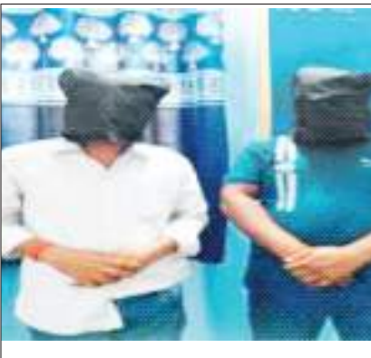
रामगढ़ से दो अफीम तस्कर गिरफ्तार