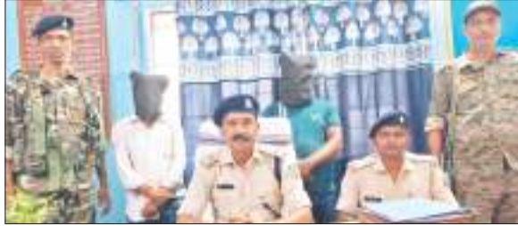
अफीम के साथ की गई गिरफ्तारी के बारे में जानकारी देते पुलिस अधिकारी।