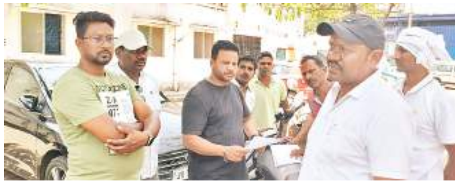
सड़क दुर्घटना में युवक की मौत के बाद श्रेष्ठ भिखारी मेडिकल कॉलेज अस्पताल पहुंचे परिजन व अन्य।

कांग्रेस नेताओं ने इस घटना पर दुख जताते हुए ब्राउन शुगर के कारोबार पर रोक लगाने की मांग की। कहा कि शहर के चौक चौराहे से लेकर होटल, ढाबा और रेस्टोरेंट में भी