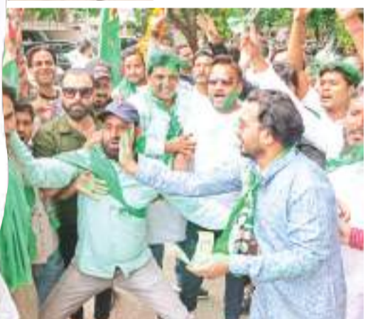
हेमंत की रिहाई के बाद खुशियां मनाते झामुमो नेता-कार्यकर्ता.