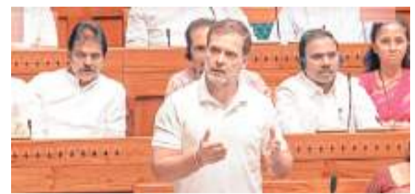
लोकसभा में शुक्रवार को अपनी बात रखते नेता प्रतिपक्ष राहुल गांधी।