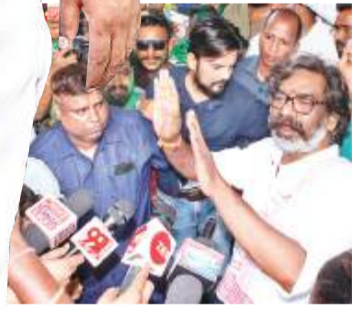
जेल से बाहर आने के बाद मीडिया से मुखातिब हेमंत सोरेन.