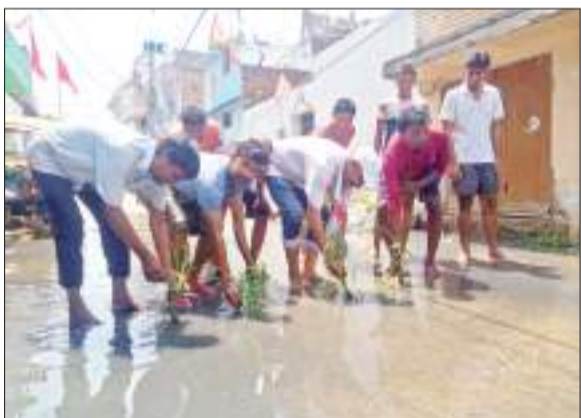
अलकापुरी राजेंद्र सिंह गली में धान रोप कर विरोध जताते युवा।