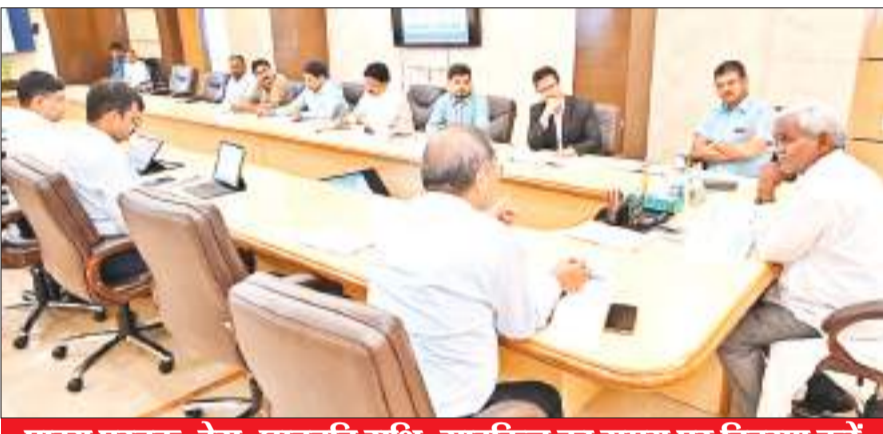
पाठ्य पुस्तक, ड्रेस, छात्रवृत्ति राशि, साइकिल का समय पर वितरण करें