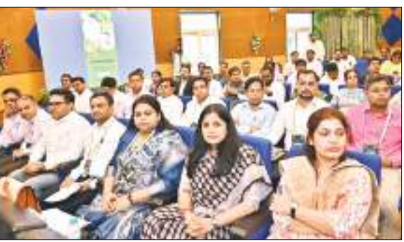
कार्यशाला में जिलों के उपायुक्त और अन्य अधिकारी।

अनुसूचित जनजाति, अनुसूचित जाति, अल्पसंख्यक और पिछड़ा वर्ग कल्याण विभाग की ओर से सीडिया इंस्टीट्यूट ऑफ पब्लिक एडमिनिस्ट्रेशन में न्याय, संरक्षण और चुनौतियां विषय पर कार्यशाला का आयोजन किया गया। वन अधिकार अधिनियम के तहत लोगों को अधिकार दिलाना सरकार की प्राथमिकता है। इसके लिए राज्य सरकार अबुआ बीर अबुआ दिशाम अभियान भी चला रही है। वन पट्टा देने में आने वाली चुनौतियों पर राज्य के आला अधिकारियों की मौजूदगी में कार्यशाला में मंथन किया गया।