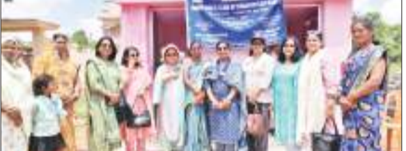
खूंटी जिले के कुंजला गांव में इनरहिल क्लब की महिला सदस्य।