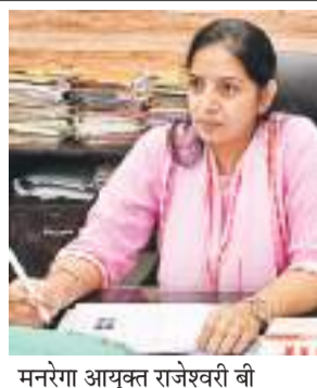
मनरेगा आयुक्त राजेश्वरी बी

मनरेगा आयुक्त राजेश्वरी बी सोमवार को सभी जिलों के परियोजना पदाधिकारियों के साथ मनरेगा के तहत संचालित योजनाओं की वीडियो कॉन्फ्रेंसिंग के माध्यम से समीक्षा बैठक कर रही थीं। मनरेगा आयुक्त ने बिरसा हरित ग्राम योजना की धामी गति पर कड़ी नाराजगी जताई। इस दौरान उन्होंने स्पष्ट कहा कि बिरसा