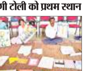
टीएलएम प्रदर्शनी दिखाते शिक्षक-शिक्षिकाएं।