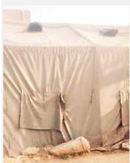
तिरपाल से बनाया गया पुलिस पिकेट.

ट्रैफिक पुलिस सुगम ट्रैफिक व्यवस्था बनाने के लिए सुबह से रात तक सड़क पर इ्यूटी पर तैनात रहते हैं। इस इ्यूटी में महिला ट्रैफिक पुलिस भी अपनी इ्यूटी शहर के कई हिस्सों में निभा रही हैं। माह में ट्रैफिक पुलिस की सुविधा के लिए पुलिस प्रशासन की ओर से चौक चौराहों में एक रूम का ट्रैफिक पोस्ट या तिरपाल नुमा ट्रैफिक पोस्ट की सुविधा दी जाती है। ताकि उन्हें गर्मी, बरसात, जाड़े में कुछ राहत मिल सके। उर्दू लाइब्रेरी के पास ट्रैफिक पोस्ट नहीं, महिला जवान परेशान : शहर में कई जगह चौराहों में ट्रैफिक पुलिस को कोई सुविधा नहीं मिली है। इस कारण वे काफी परेशान रहते हैं। मेरा रोड में उर्दू लाइब्रेरी के पास इ्यूटी में नौ पुलिस जवान तैनात रहते हैं, इनमें