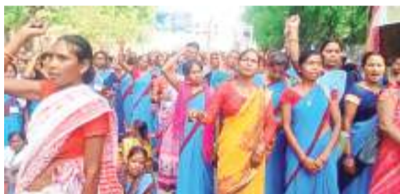
राजभवन के समक्ष प्रदर्शन करती जलसहिया।