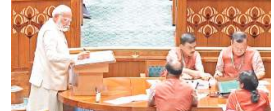
नेता सदन नरेंद्र मोदी सोमवार को लोकसभा सदस्य के रूप में शपथ लेने के बाद हस्ताक्षर करते हुए.