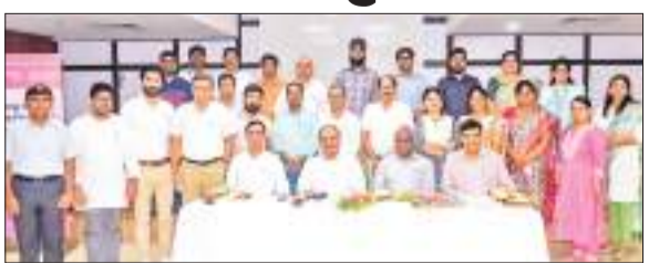
कार्यशाला में मौजूद देश भर के तकनीकी शिक्षण संस्थानों के शिक्षाविद।

देश भर से विभिन्न तकनीकी और शैक्षणिक संस्थानों के कुल 18 संकाय सदस्यों ने आईआईटी (आईएसएम), धनबाद में एकत्रित होकर शिक्षण की बारीकियों को सीखा। मौका था प्रतिष्ठित मालवीय मिशन शिक्षण प्रशिक्षण कार्यक्रम के तहत आयोजित पांच दिवसीय पोषण भ्रमिष्य नेतृत्व कार्यक्रम का। इस दौरान बातचीत कौशल विकसित करना, प्रभाव और अनुनय, नेतृत्व प्रेरणा, संचार कौशल-मौखिक और व्यक्तिगत और संगठनात्मक विकास के लिए सीखने की मानसिकता की संस्कृति बनाना आदि विंदुओं पर विचारों का आदान-प्रदान हुआ। पांच दिनों तक चलने वाले