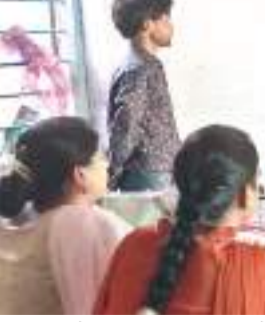
पूरी पढ़ाई देश की भलाई अभियान में शामिल स्कूली बच्चे व अन्य.

गढ़ा टोली, एचबी रोड में सोमवार को हर लड़की को 12वीं तक की शिक्षा सुनिश्चित करने की आवश्यकता पर भारत की अग्रणी बाल अधिकार संगठन क्राई चाइल्ड राइट्स एंड यू ने पूरी पढ़ाई देश की भलाई अभियान शुरू किया।