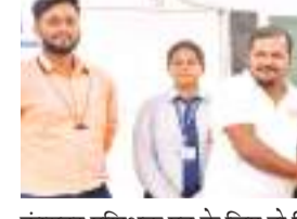
कंप्यूटर प्रशिक्षक पद के लिए दो दिवसीय भर्ती अभियान में शामिल स्टूडेंट्स.