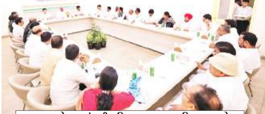
भाजपा ने झारखंड की अस्मिता का अपमान किया : खरगे

झारखंड विधानसभा चुनाव की रणनीति तैयार करने के लिए दिल्ली में कांग्रेस अध्यक्ष मल्लिकार्जुन खरगे द्वारा बुलायी गयी बैठक कई मायनों में महत्वपूर्ण रही. बैठक में खरगे और पूर्व कांग्रेस अध्यक्ष राहुल गांधी ने विधानसभा चुनाव को लेकर रणनीति तैयार करने के साथ ही साथ नेताओं को आवश्यक दिशा-निर्देश दिये. प्रदेश कांग्रेस प्रभारी, अध्यक्ष से लेकर झारखंड के कई नेताओं ने बैठक में हिस्सा लिया. बैठक के दौरान प्रदेश कांग्रेस कमेटी द्वारा लोकसभा चुनाव परिणाम की आरंभिक समीक्षा रिपोर्ट रखी गई. लोकसभा चुनाव में सभी सामान्य सीटों से कांग्रेस प्रत्याशी के पराजित होने पर कांग्रेस के पूर्व अध्यक्ष राहुल गांधी ने कड़ी