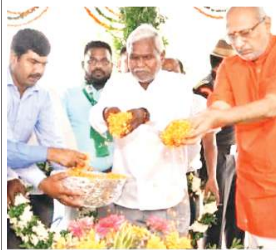
राज्यपाल सीपी राधाकृष्णन व मुख्यमंत्री चंपाई सोरेन ने भगवान बिरसा मुंडा की पुण्यतिथि पर उन्हें श्रद्धांजलि दी।