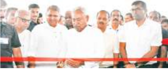
कन्वेंशन सेंटर का लोकार्पण के मौके पर सीएम नीतीश कुमार व अन्य.

मुख्यमंत्री नीतीश कुमार ने गुरुवार को पश्चिमी चंपारण जिले के वाल्मिकिनगर में 120 करोड़ की लागत से निर्मित अंतरराष्ट्रीय कन्वेंशन सेंटर का लोकार्पण किया. साथ ही परिसर में स्थापित महर्षि वाल्मीकि की प्रतिमा का अनावरण कर वहां पौधरोपण भी किया. मुख्यमंत्री भारी बारिश के बीच प.चंपारण के वाल्मिकिनगर पहुंचे. उन्होंने 120 करोड़ की लागत से बने अंतरराष्ट्रीय कन्वेंशन सेंटर के साथ अतिथि गृह का लोकार्पण किया.