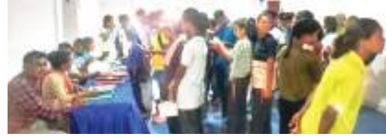
चयन ट्रायल के लिए रजिस्ट्रेशन कराने पहुंचे बच्चे।

रांची। झारखंड खेलकूद एवं युवा कार्य विभाग द्वारा दक्षिणी छोटानागपुर प्रमंडल के आवासीय खेल प्रशिक्षण केंद्र और सेंटर ऑफ एक्सीलेंस (एकलव्य केंद्रों) के लिए चयन ट्रायल का आयोजन किया जा रहा है। इसके लिए गुरुवार को रजिस्ट्रेशन की प्रक्रिया रांची के जयपाल सिंह मुंडा एस्टेट ऑफ हॉकी स्टेडियम में की गई। जिसमें 300 से अधिक बच्चों ने अपना रजिस्ट्रेशन कराया। खेल विभाग की ओर से जानकारी दी गई कि शुक्रवार को भी बच्चे रजिस्ट्रेशन करा सकेंगे। रांची, खूंटी, सिमडेगा, गुमला एवं लोहरगा जिलों में स्वीकृत नए केंद्रों के लिए 28 - 29 जून तक चयन ट्रायल प्रतियोगिता का आयोजन किया जाएगा। इसमें बैडमिंटन, फुटबॉल, तीरंदाजी, हॉकी, एथलेटिक्स के लिए प्रतिभागियों का चयन किया जाएगा। भाग लेने वाले प्रतिभागी को आवेदन के साथ आधार कार्ड की छायाप्रति देना अनिवार्य है। चयन मातृक के आधार पर बेंदरी एवं स्कूल टेस्ट पर खिलाड़ियों का परीक्षण किया जाएगा।