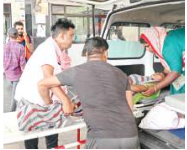
महिला मरीज को एंबुलेंस से स्ट्रेचर पर लादते उसके परिजन.