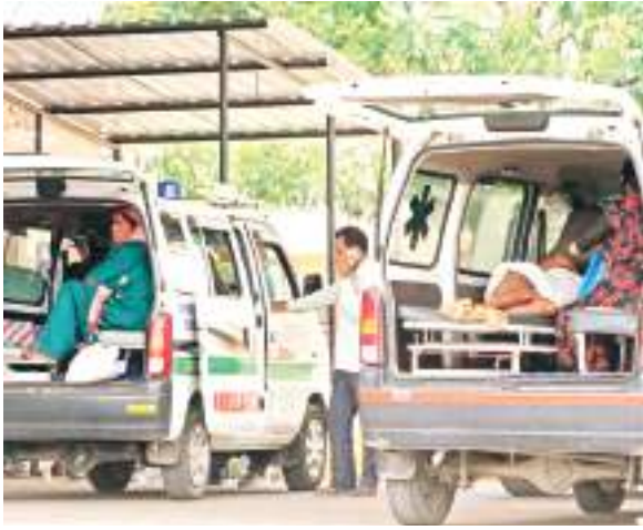
एंबुलेंस से मरीज को अंदर ले जाने के लिए वार्ड ब्वाय का इंतजार करते परिजन.

व्यवस्था फेल, जिम्मेदार मौन? मरीज को खुद ही स्ट्रेचर पर लादिए, खुद खींचिए