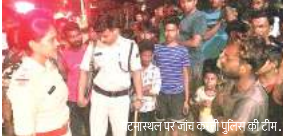
टमास्थल पर जांच का पोलिस की टीम.