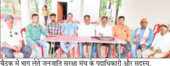
बैठक में भाग लेते जनजाति सुरक्षा मंच के पदाधिकारी और सदस्य।