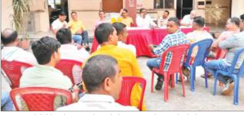
जगन्नाथपुर थाने में मेले की टेंडर प्रक्रिया में भाग ले रहे अधिकारी एवं टेंडर डालनेवाले लोग।