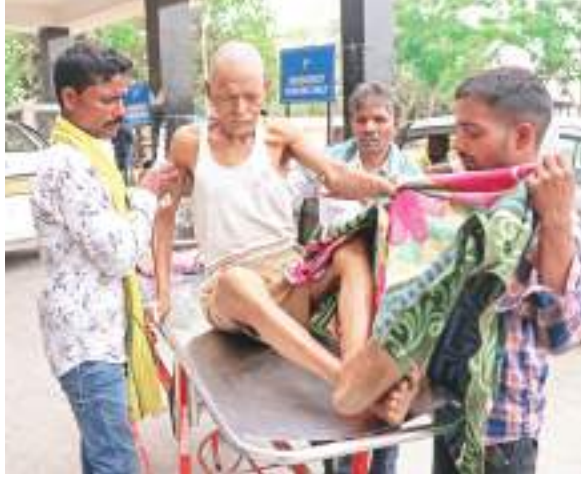
वार्ड ब्वाय नहीं मिला, तो खुद ही बुजुर्ग मरीज को ले जाते उसके परिजन.