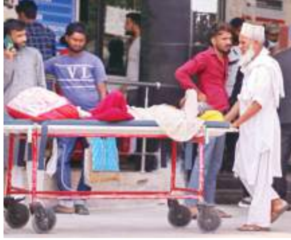
स्ट्रेचर पर अपनी बुजुर्ग पत्नी को इलाज के लिए रिम्स के अंदर ले जाता पति.