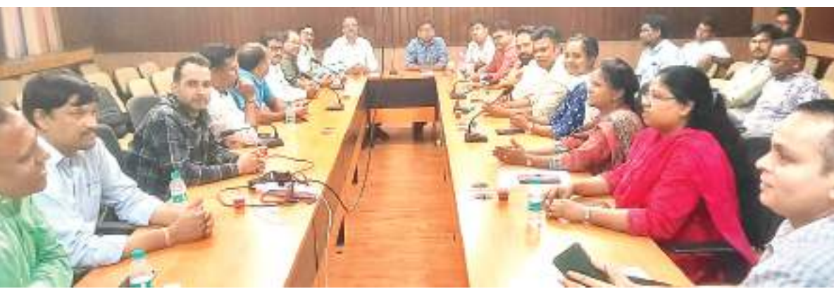
पदाधिकारियों के साथ वार्ता करते सचिवालय सेवा के पदाधिकारी।