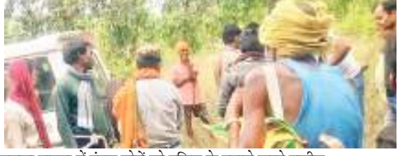
बड़का हातमा में एंगल चोरों को पुलिस के हवाले करते ग्रामीण.