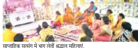
साप्ताहिक सतसंग में भाग लेतीं श्रद्धालु महिलाएं।