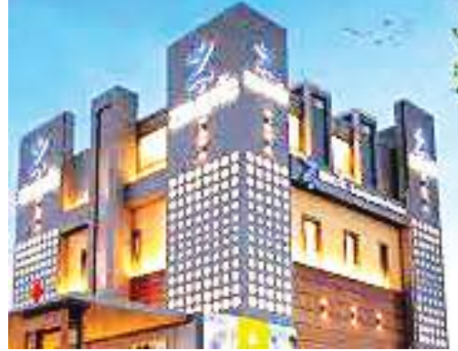
जेनेटिक हॉस्पिटल की आलीशान बिल्डिंग.