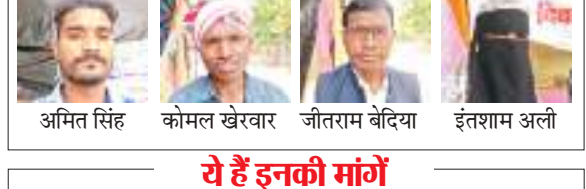
संवाददाता | रांची