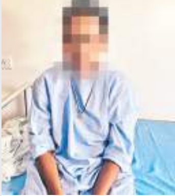
जेनेटिक हॉस्पिटल में कैद खूंदी की महिला मरीज.