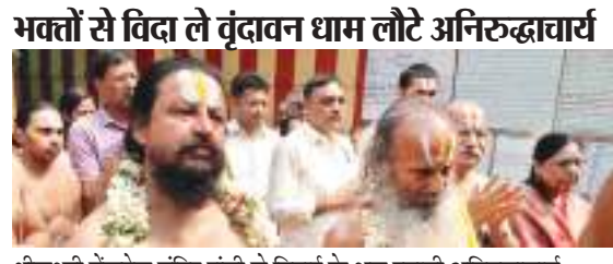
श्रीलक्ष्मी वैकंठेश मंदिर रांची से विदाई के क्षण स्वामी अनिरुद्धाचार्य।