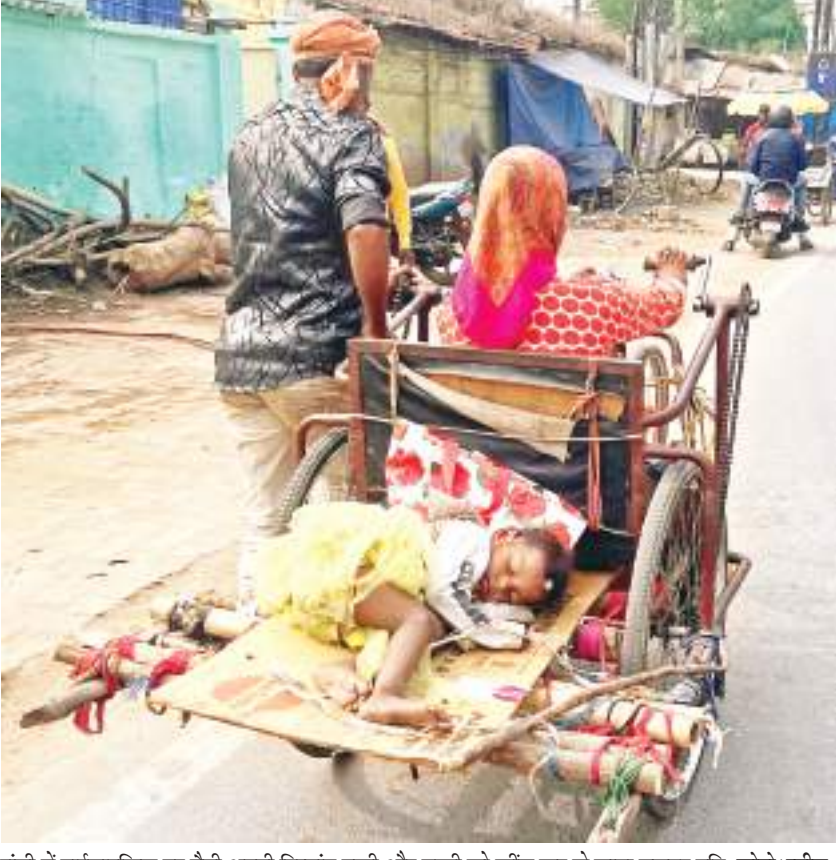
रांची में ट्राईसाइकिल पर बैठी अपनी दिव्यांग पत्नी और बच्ची को खींच कर ले जाता मजदूर पति.