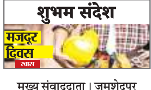
मुख्य संवाददाता | जमशेदपुर