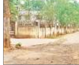
जर्जर सड़क, जिससे बना रहता है हादसे का डर।

की यह हालत है तो सुदूरवांती गांवों की सड़कों की हालत का अंदाजा सहज ही लगाया जा सकता है। समाहरणालय जाने का शॉर्टकट सड़क : बता दें कि यह सड़क समाहरणालय के अलावा राजकीयकृत प्लस टू उच्च विद्यालय, आदिवासी बायोओइड व थैपनर भवन तक जाने का एक शॉर्टकट है।