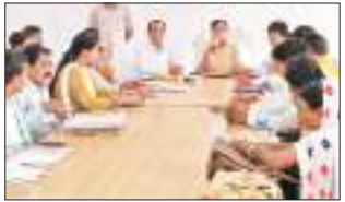
प्रखंड कर्मियों के साथ समीक्षात्मक बैठक करते डीडीसी