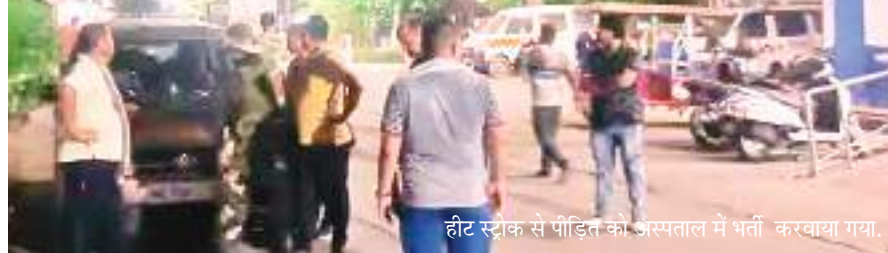
हीट स्ट्राक से पीड़ित को अस्पताल में भर्ती करवाया गया।