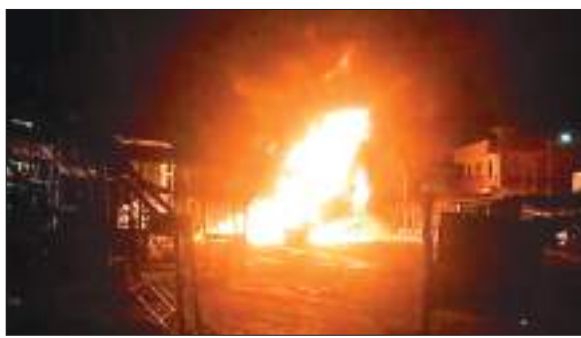
बीच सड़क पर धूँ-धूँ कर जल रहा कोयला लदा ट्रेलर.

इधर, घटना से आक्रोशित ग्रामीणों ने ट्रेलर में आग लगा दी. इसके बाद सड़क जाम कर जाम में फंसे कई वाहनों का शीशा तोड़ दिया और कुछ लोगों के साथ मारपीट भी की. भौड़ में शामिल लोगों ने ट्रक