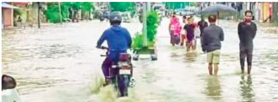
इंफाल घाटी के शहरों में कुछ इस तरह पानी भरा हुआ है।

मणिपुर की इंफाल घाटी में भारी बारिश के कारण आई बाढ़ से तीन लोगों की मौत हो गई और हजारों लोग प्रभावित हुए हैं। अधिकारियों ने गुरुवार को यह जानकारी दी। अधिकारियों ने बताया कि बुधवार को सेनापति जिले के थोंगलांग रोड पर भारी बारिश के कारण हुए भूस्खलन में