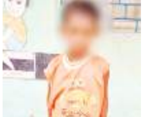
चार साल की मासूम बच्ची

सोशल मीडिया एवं स्थानीय युवकों के सकारात्मक प्रयास से चार वर्षीय बच्ची को सकुशल उसकी मां के पास पहुंचाया गया. यह बच्ची 29 जून की रात में अकेले भटकती मिली थी. वह बता रही थी कि बस से काफी दूर से आये हैं. इसके बाद उस किरीबुरु थाना पहुंचाया गया. किरीबुरु पुलिस ने बच्चों को एस्पयार संस्था द्वारा संचालित आरबीसी स्कूल में सुरक्षित रखा. गुरुवार की सुबह पता चला कि वह बच्ची सभी से झूठ बोली थी. वह किरीबुरु के ही मेन मार्केट की रहने वाली है.