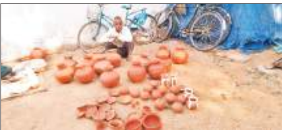
ग्राहकों के इंतजार में भंडारा का कुम्हार।

मटके आज उपेक्षा का शिकार हैं। मटके बनाने वाले कुम्हार समाज के कारीगर प्रखंड गर्मी का सीजन होने के बावजूद खाली हाथ बैठे हैं। ग्रामीण इलाकों में तो हर परिवार के घर मिट्टी के मटके हर समय ठंडे जल से भर