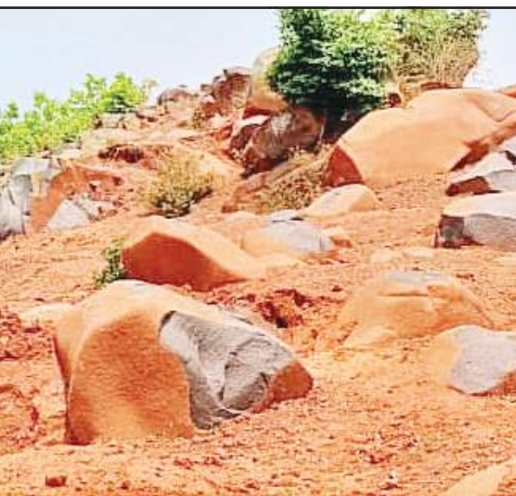
पेड़ कटने के बाद वीरान पड़े पहाड़.