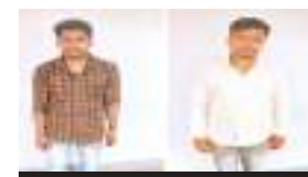
सजायाफ्ता नशा कारोबारी

कोर्ट ने एक-एक लाख रुपये का जुर्माना भी लगाया