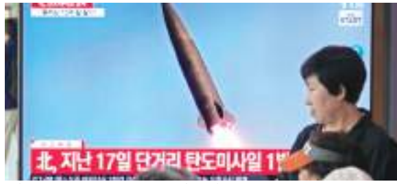
बैलेस्टिक मिसाइलों की जानकारी देती कोरियाई अधिकारी।

उत्तर कोरिया ने गुरुवार को अपने पूर्वी जलक्षेत्र की ओर कई संदिग्ध बैलेस्टिक मिसाइल दागीं। दक्षिण कोरियाई सेना ने यह जानकारी दी। उत्तर कोरिया ने एक सैन्य टोही उपग्रह प्रक्षेपण में असफल होने के एक दिन बाद इस कार्रवाई को अंजाम दिया। दक्षिण कोरिया के ज्वाइंट चीफ ऑफ स्टाफ ने कहा कि उत्तर कोरिया ने राजधानी प्योंगयंग के समीप एक इलाके से करीब 10 प्रक्षेपास्त्र दागे, जो कम दूरी की