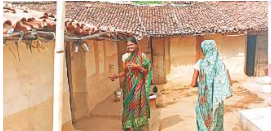
शुभम संदेश की टीम को अपने कच्चे मकान के बारे में बताती महिला।

दरअसल, हजारीबाग जिले के कई पंचायतों में जनप्रतिनिधि मोटी रकम लेकर अपने पक्ष में वोट देने वाले लोगों को अबुआ आवास योजना का लाभ दे रहे हैं। ऐसे में गरीब परिवार आज भी कच्चे मकान में रहने को मजबूर हैं। जनप्रतिनिधि के खिलाफ बोलने से भी डरते हैं। इसकी शिकायत किसी अधिकारी को करना नहीं चाहते, लेकिन जनप्रतिनिधि के कारनामों का वीडियो आए दिन वायरल होता रहता है,