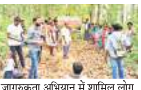
वन जागरूकता अभियान में शामिल लोग

सेन्हा-लोहरदगा। वन सुरक्षा जागरूकता के तहत आरा तथा रानीगंज जंगल में वन प्रमंडल लोहरदगा के तत्वावधान वृक्षों में रक्षासूत्र बांध ग्रामीणों को जागरूक किया गया। उक्त कार्यक्रम सेन्हा प्रखंड के अलौदी पंचायत स्थित आरा तथा रानीगंज जंगल में वन कर्मियों ने रक्षासूत्र तथा जंगल बचाव कार्यक्रम चलाया गया। कार्यक्रम आरम्भ होने के पूर्व आदिवासी रीतिरिवाज के अनुसार पाहन पुजार के द्वारा विधिवत धरती पूजा कर कार्यक्रम की शुरुआत की।