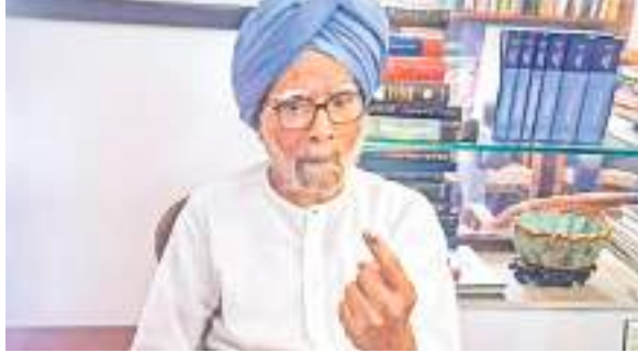
मतदाताओं से अपील करते पूर्व प्रधानमंत्री मनमोहन सिंह।