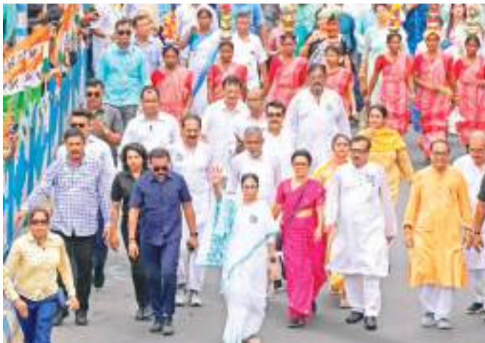
एक जून को लोकसभा चुनाव के अंतिम चरण के लिए प्रचार गुरुवार की शाम को थमा गया। आखिरी दिन पीएम मोदी ने पंजाब के होशियारपुर में सभा की, ममता बनर्जी ने कोलकाता में पैदल मार्च किया, वहीं अरविंद केजरीवाल ने पंजाब के संगरूर में रोड शो किया।