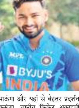
पाऊंगा और यहां से बेहतर प्रदर्शन करूंगा। राष्ट्रीय क्रिकेट अकादमी

पहनी थी, लेकिन वह नीले रंग की एक अलग जर्सी पहनने के लिए अधिक उत्सुक हैं- भारत की नीली जर्सी। एक जून को बांग्लादेश के खिलाफ अभ्यास मैच से पूर्व भारत के पहले नेट सत्र के इतर पंत ने बीसीसीआई टीवी से कहा, भारतीय जर्सी पहन कर मैदान पर वापस आना एक अलग ही अहसास है। यह कुछ ऐसा है जिसकी मुझे बहुत याद आती थी... उम्मीद है कि मैं इसे भुना