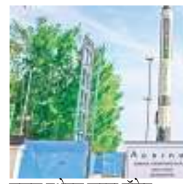
सफल प्रक्षेपण करता रॉकेट।