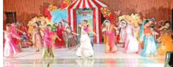
समर कैंप के समापन पर सांस्कृतिक कार्यक्रम पेश करते बच्चे.