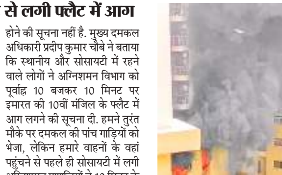
नोएडा के फ्लैट में लगी आग।