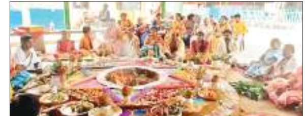
बालाजी मंदिर में ब्रह्मोत्सव पूजा के दौरान सुदर्शन होम में शामिल श्रद्धालु.

चक्रधरपुर के रेल नगरी पंचमोड़ स्थित बालाजी मंदिर का 41वां वार्षिक ब्रह्मोत्सव एवं भगवान गणेश मंदिर का पहला वार्षिकोत्सव समारोह प्रारंभ हो गया. इस बीच वैदिक मंत्रोच्चारण से आसपास का क्षेत्र भक्तिमयी हो उठा. बुधवार देर शाम आंध्र प्रदेश से पहुंचे पुजारियों द्वारा इसका विधिवत तरीके से शुभारंभ किया गया. जहां मुख्य रूप से सहायकेला-खरसावां जिला के उपायुक्त रवि शंकर शुक्ला भी उपस्थित हुये. इस दौरान उपायुक्त रवि शंकर शुक्ला ने ब्रह्मोत्सव अनुष्ठान की पूजा अर्चना की. मौके पर चक्रधरपुर भगवान