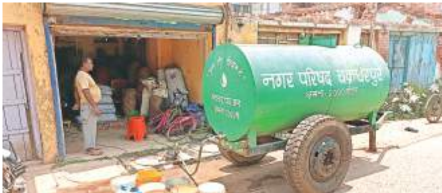
चक्रधरपुर के तम्बाकू पट्टी रोड में पानी की समस्या उत्पन्न होने पर नगर परिषद् के टैंकर से किया जा रहा पानी सफ़ाई.