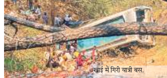
खाई में गिरी यात्री बस।

एक वरिष्ठ अधिकारी ने बताया कि बुधवार रात को यह हादसा उस समय