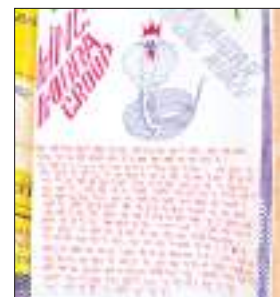
घर के बाहर चस्पा किया गया पोस्टर.