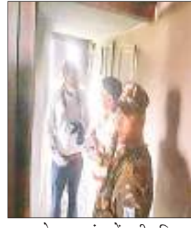
घटना के बाद जांच में जुटी पुलिस।