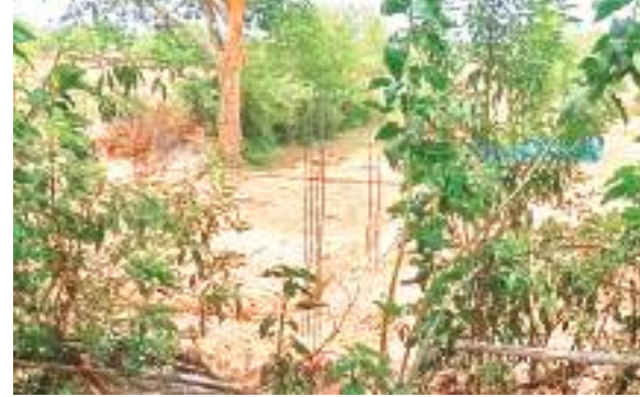
एक लाभुक का बनाया जा रहा आवास।

जिसमें वह कहीं 20 हजार रुपये तो कहीं 10 हजार रुपये की मांग करते स्पष्ट रूप से सुना जाता है। वहीं कई पंचायतों के ग्रामीणों ने शुभम संदेश कार्यालय आकर अपनी पीड़ा बताई। जनप्रतिनिधि की शिकायत सरकार तक पहुंचने का निवेदन किया। इसके बाद शुभम संदेश की टीम ने गुरुवार को सदर प्रखंड की गुरहेत और सखिया पंचायत में विकास की सच्चाई जानने के लिए निकल पड़ी। स्थानीय लोगों से बातचीत की तो सच्चाई सामने आई। हालांकि ग्रामीण काफी डरे हुए थे। वह कुछ बताना नहीं चाह रहे थे, लेकिन नाम नहीं