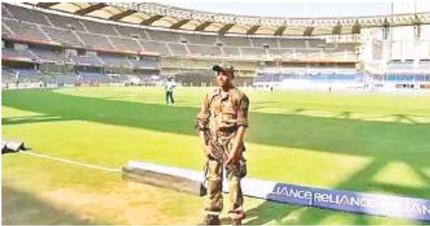
स्टेडियम के बाहर तैनात सुरक्षार्थी।

एजेंसी। न्यूयॉर्क आतंकी हमले के खतरे को देखते हुए न्यूयॉर्क की नासाऊ काउंटी में नौ जून को भारत और पाकिस्तान के बीच होने वाले टी20 विश्व कप मुकाबले के लिए अभूतपूर्व सुरक्षा व्यवस्था होगी। राज्य की गवर्नर कैथी होचुल ने हालांकि जोर देकर कहा कि यह इस बार खतरा विश्वसनीय नहीं है। नासाऊ काउंटी के आईसेनहावर पार्क स्टेडियम में टूर्नामेंट के आठ मैच खेले जाएंगे, जिसमें भारत के तीन मैच भी शामिल हैं। भारतीय टीम एक जून को यहां बांग्लादेश के खिलाफ अभ्यास मैच भी खेलेगी।