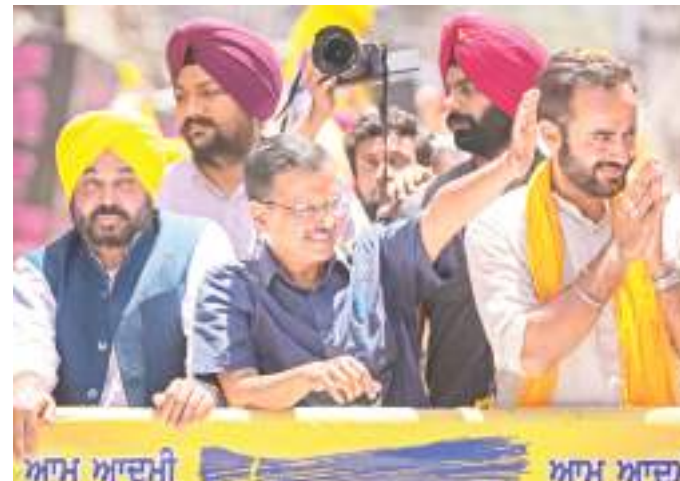
एक जून को लोकसभा चुनाव के अंतिम चरण के लिए प्रचार गुरुवार की शाम को थमा गया। आखिरी दिन पीएम मोदी ने पंजाब के होशियारपुर में सभा की, ममता बनर्जी ने कोलकाता में पैदल मार्च किया, वहीं अरविंद केजरीवाल ने पंजाब के संगरूर में रोड शो किया।