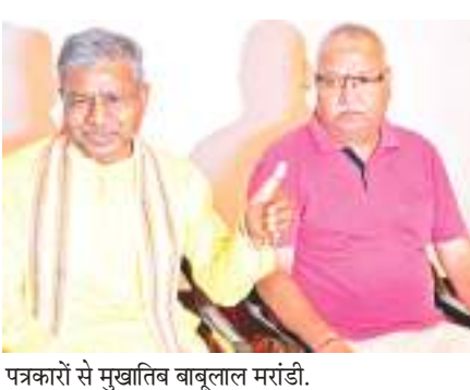
प्रकारों से मुखातिब बाबूलाल मरांडी.

भाजपा के प्रदेश अध्यक्ष बाबूलाल मरांडी ने कहा है कि संतालपरगना क्षेत्र में संताल, पहाड़िया आदिवासियों की आबादी का लगातार कम होना खतरों की घंटी है. जब संताल में पहाड़िया की आबादी घटी, तब बढ़ी किसकी है, यह जांच का विषय है. वे गुरुवार को दुमका में मीडिया से बात कर रहे थे. उन्होंने कहा कि पाकुड़ इलाके में पहाड़ियों के गांव उजड़ गये. वहां कभी पहाड़िया आबादी थी, वहां घुसपैठियों की बड़ी आबादी है.