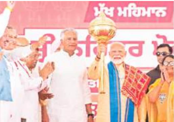
एक जून को लोकसभा चुनाव के अंतिम चरण के लिए प्रचार गुरुवार की शाम को थमा गया। आखिरी दिन पीएम मोदी ने पंजाब के होशियारपुर में सभा की, ममता बनर्जी ने कोलकाता में पैदल मार्च किया, वहीं अरविंद केजरीवाल ने पंजाब के संगरूर में रोड शो किया।