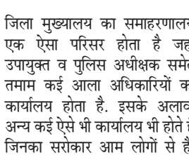
जिला मुख्यालय का समाहरणालय एक ऐसा परिसर होता है जहां उपयुक्त व पुलिस अधीक्षक समेत तमाम कई आला अधिकारियों का कार्यालय होता है। इसके अलावा अन्य कई ऐसे भी कार्यालय भी होते हैं जिनका सरोकार आम लोगों से है। जिले के लोग समाहरणालय में अपनी समस्याओं को लो कर पहुंचते हैं। इसी समाहरणालय से धर्मपुर मोड़ तक जाने वाली सड़क की हालत खस्ता है। यह सड़क समाहरणालय के पीछे से धर्मपुर मोड़ के पास निकलती है। इस सड़क में बेशुमार गड्डे हो गये हैं। पता ही नहीं चलता कि सड़क में गड्डे हैं या फिर गड्डों में सड़क है। बरसात के दिनों में तो परेशानी और अधिक बढ़ जाती है। समाहरणालय के पीछे की सड़क