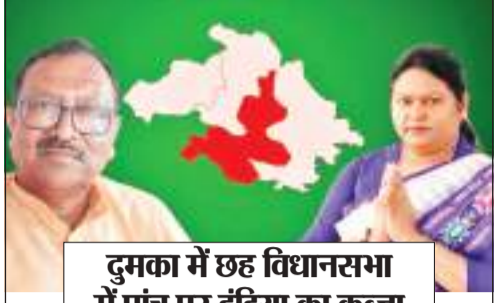
दुमका में छह विधानसभा में पांच पर इंडिया का कब्जा

दुमका में कुल छह विधानसभा सीटें हैं, जिसमें वर्तमान में पांच पर इंडिया गठबंधन यानी कि शिकारीपाड़ा, नाला, दुमका और जामा पर झामुमो कब्जा है, वहीं जामताड़ा में कांग्रेस और भाजपा का एक सीट सारट पर कब्जा है। नाला जिससे सीता सोरेन विधायक हैं, वर्तमान में झामुमो से इस्तीफा देकर भाजपा की टिकट पर चुनाव लड़ रही हैं। तीन सीट एसटी सीट है।