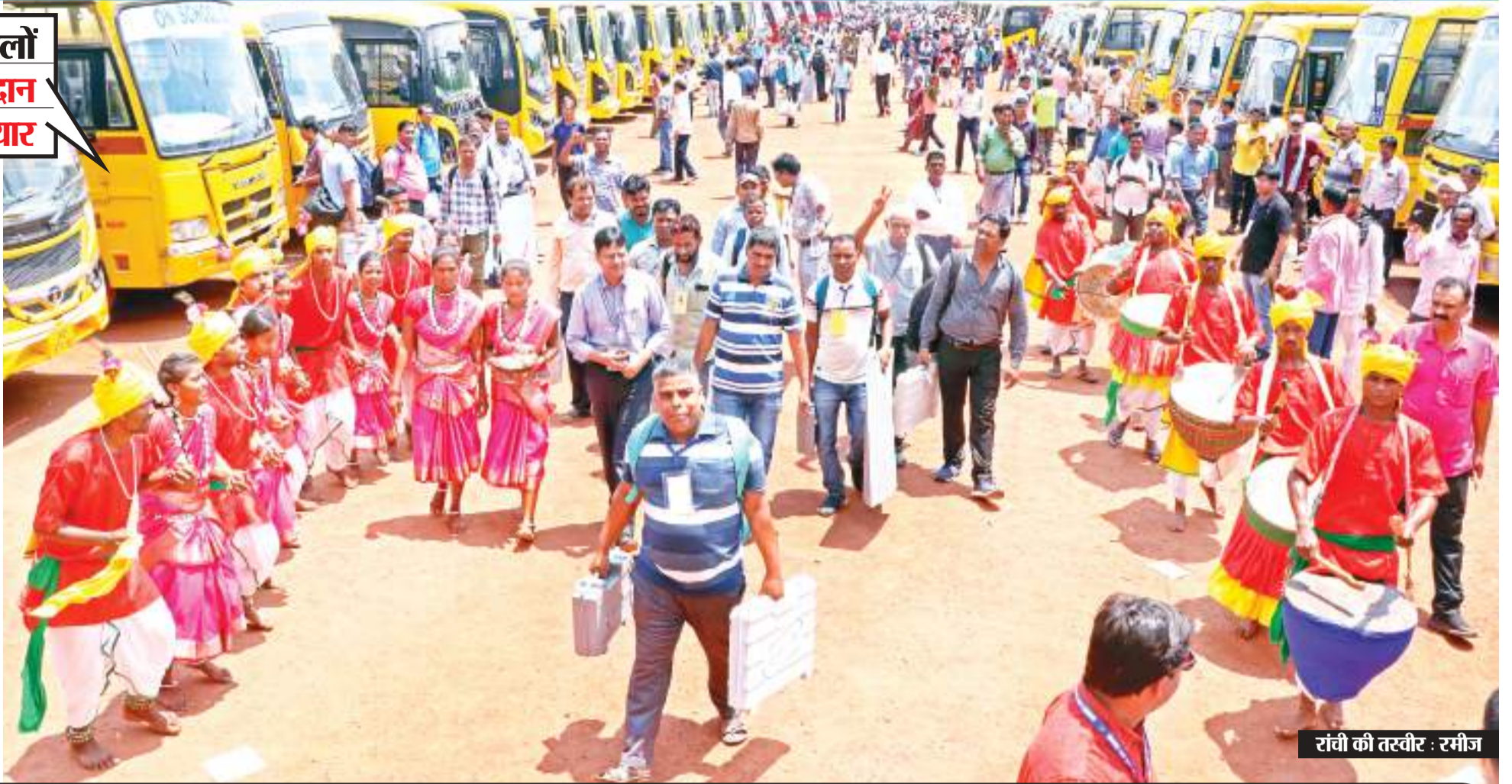
रांची की तस्वीर : रमीज

रांची, जमशेदपुर (पूर्वी सिंहभूम), गिरिडीह और धनबाद लोकसभा सीटों के लिए मतदान होगा। प्रशासनिक स्तर पर इसकी तैयारी पूरी कर ली गई है। मतदानकर्मी ईवीएम के साथ अपने अपने केंद्रों में पहुंच चुके हैं। सुरक्षा की चाक-चौबंद व्यवस्था के बीच मतदान होगा। प्रशासनिक स्तर पर यह भी कोशिश की गई है कि मतदाताओं को वोट करने में कोई दिक्कत न हो।