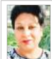
ज़ॉ. कविता विकास

खुद को जब उलझनों में पाती थी, मां, तुम्हारी ही याद आती थी. अब तो यादें ही रह गयीं दिल में. अब जिसके समय बिताती थी. जाफ़रानी थी मां, रही वो जहां, एक खुशबू वहां से आती थी. उसके पल्लू में बैठ कर मैं तो,