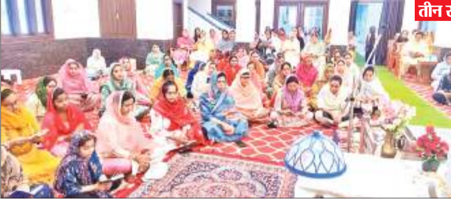
गुरुद्वारा साहिब की ओर से गुरुमत ट्रेनिंग कैम्प 28 मई से दो जून तक चलाया जायेगा। इसमें पांच से 15 वर्ष के विद्यार्थी भाग ले सकते हैं। भाग लेने के इच्छुक 25 मई तक निबंधन

कर सकते हैं। उन्होंने बताया कि नौ जून से दो दिनों गुरु अर्जन देव जी का शहादत दिवस श्रद्धा पूर्वक मनाया जायेगा। पहले दिन मेन रोड गुरुद्वारा साहिब में रात्रिकालीन दीवान सजेगा।