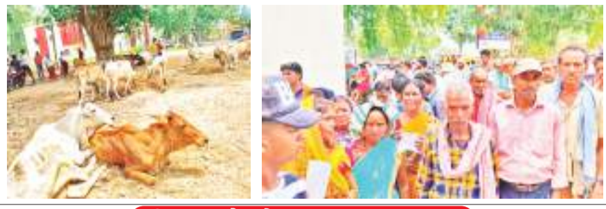
पिक-अप वैन में दूंस-दूंस कर लादकर ले जाया जा रहा था। पुलिस सूत्रों के अनुसार एक एक पिकअप वैन में 12 से 15 गोवंशीय पशुओं को लादा गया था।