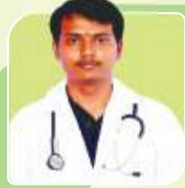
ABHAY AIIMS PATNA