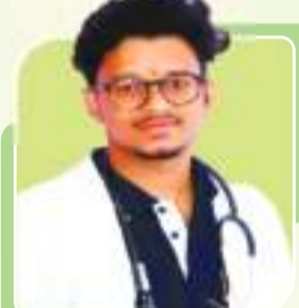
AMRENDRA PMCH PATNA