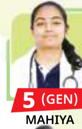
5 (GEN) MAHIYA