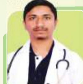
TANJIL JNMC AMU, ALIGARH