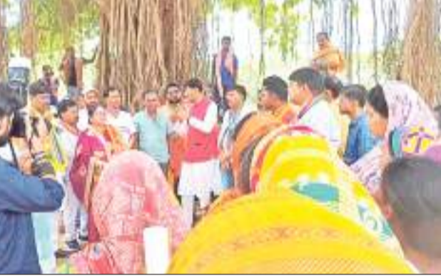
ग्रामीणों से बात करते सांसद.

चांडिल । रांची लोकसभा क्षेत्र से भारतीय जनता पार्टी के प्रत्याशी सांसद संजय सेठ मंगलवार को चुनाव प्रचार करने ईचागढ़ विधानसभा क्षेत्र अंतर्गत ईचागढ़ प्रखंड के विभिन्न गांवों का दौरा करने पहुंचे. इस दौरान वे चांडिल डैम के डूब क्षेत्र के विस्थापित गांवों का भी दौरा करेंगे और मतदाताओं से समर्थन मांगेंगे. सांसद के दौरे को लेकर भाजपा के स्थानीय नेता व कार्यकर्ता उत्साहित है. सांसद संजय सेठ निर्धारित समय पर ठीक 11 बजे क्षेत्र में पहुंचे और सबसे पहले ईचागढ़ प्रखंड के देवलटांड पंचायत के नवाडीह गांव से अपना चुनाव प्रचार अभियान शुरू किया. निर्धारित कार्यक्रम के अनुसार नवाडीह से प्रचार अभियान प्रारंभ करने के बाद वे रुगडी, आगसिया, कुंदरीलौंग, घाटिया, काशीडीह, लेपाटांड, ईचागढ़, पुरानडीह, बाकलतोडिया, तामारी, पानकुम और बांदु में जनसंवाद कार्यक्रम करेंगे. जन संवाद कार्यक्रम का समापन शाम छह बजे ईचागढ़ प्रखंड के बांदु पंचायत में होगा.