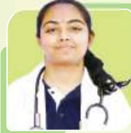
MAHIYA AIIMS HRISHIKESH