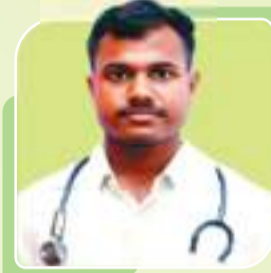
JYOTIRMOY AIIMS KALYANI