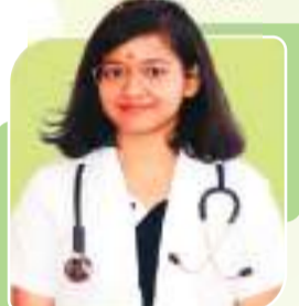
SHREYA LADY HARDINGE DELHI