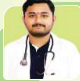
ADITYA AIIMS PATNA