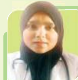
SEEMAB JNMC AMU, ALIGARH