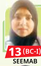
13 (BC-I) SEEMAB