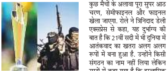
टीमें भाग ले रही हैं. मीडिया रपटों के अनुसार धमकी वेस्टइंडीज को मिली है. वेस्टइंडीज में प्रारंभिक दौर के कुछ मैचों के अलावा पूरा सुपर आठ चरण, सेमीफाइनल और फाइनल खेला जाएगा...