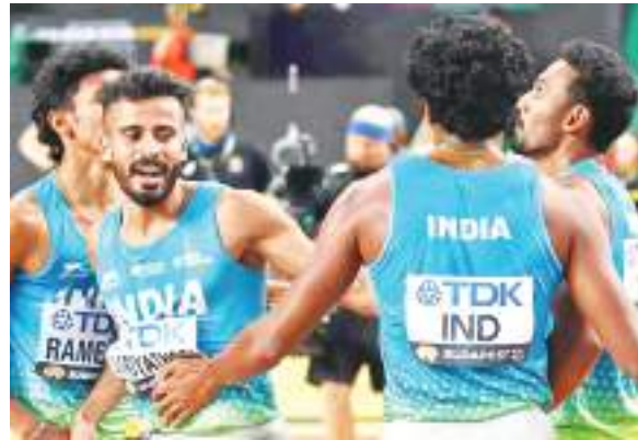
एजेंसी। नासाउ (बहामास)