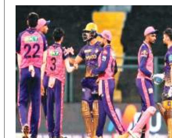
एजेंसी। नयी दिल्ली