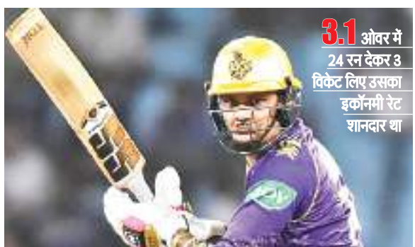
3.1 ओवर में 24 रन देकर 3 विकेट लिए उसका इकॉनमी रेट शानदार था