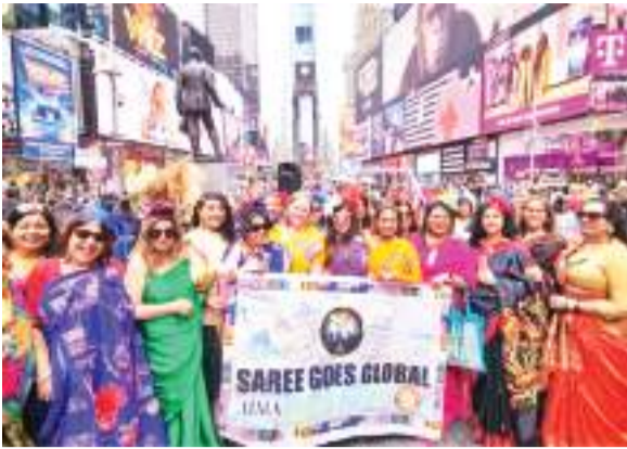
का यह परिधान लोकप्रिय है तथा उत्पत्ति संदर्भित किया जाता है। इन देशों में बांग्लादेश, नेपाल, ब्रिटेन, अमेरिका, संयुक्त अरब अमीरात, यूगांडा, निजिदाद और गुयाना शामिल हैं। खादी सहित

न्यूयॉर्क का प्रतिष्ठित 'टाइम्स स्क्वायर' पर सैकड़ों महिलाओं की भिन्न प्रकार और शैलियों की साड़ियों से सजा दिखायी दिया तथा भारतीय-अमेरिकी समुदाय के साथ ही अन्य देशों की सैकड़ों महिलाओं ने यहां एक विशेष कार्यक्रम में साड़ियों की शाश्वत सुंदरता, विरासत और सांस्कृतिक विविधता का प्रदर्शन किया। 'टाइम्स स्क्वायर' में शनिवार को आयोजित 'साड़ी गोज ग्लोबल' कार्यक्रम में भारतीय समुदाय के साथ ही कम से कम उन नौ देशों की 500 से अधिक महिलाओं ने भाग लिया जहां नौ राज