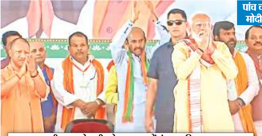
सीताराम केसरी को बाथरूम में बंद कर दिया था

भारत आज घर में घुसकर मारता है: मोदी ने कहा, आज भारत में कांग्रेस की कमजोर सरकार नहीं है बल्कि मोदी की मजबूत सरकार है, अगर डरना है तो वे लोग डरें जो मानवता में विश्वास नहीं करते, जो