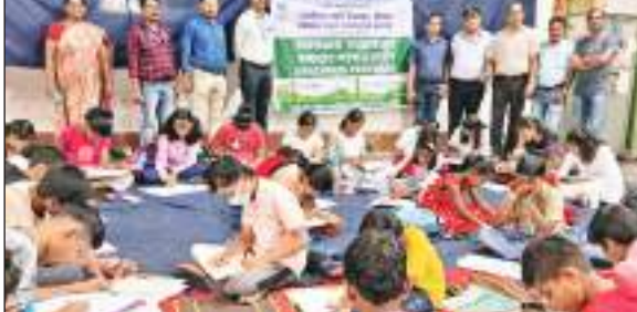
संवाददाता । मैथन

डीवीसी मैथन परियोजना में बुधवार को स्वच्छता पखवाड़ा के तहत डीवीसी वेलफेयर सेंटर में स्कूली बच्चों के लिए चित्रांकन और स्लोगन प्रतियोगिता का आयोजन किया गया। चित्रांकन और स्लोगन का विषय स्वच्छता रखा गया था। कार्यक्रम में विभिन्न स्कूलों के करीब 55 बच्चों ने अपने प्रतिभा का जौहर दिखाया। प्रतियोगिता में विजयी बच्चों को स्वच्छता पखवाड़ा के समापन