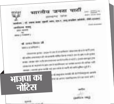
भाजपा का नोटिस