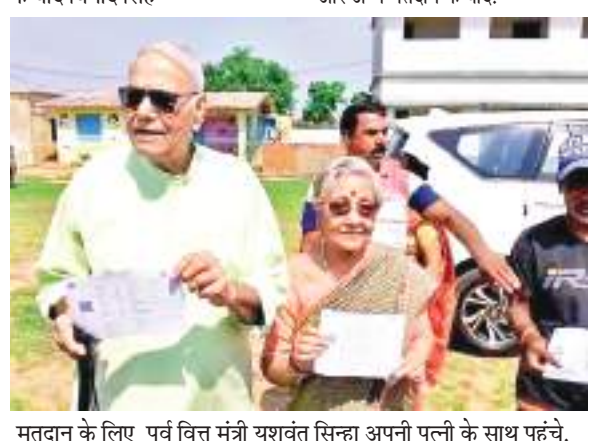
मतदान के लिए पूर्व वित्त मंत्री यशवंत सिन्हा अपनी पत्नी के साथ पहुंचे.