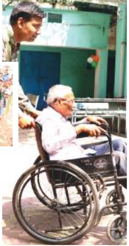
हजारीबाग: मतदान के लिए हिल चेर पर पहुंच चुक.