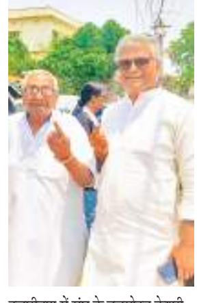
हजारीबाग में संघ के बुजुर्गमोहन केशरी और अन्य मतदान के बाद.