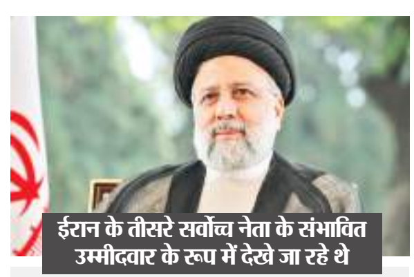
ईरान के तीसरे सर्वोच्च नेता के संभावित उम्मीदवार के रूप में देखे जा रहे थे

ईरान के सर्वोच्च नेता अयातुल्ला अली खामेनेई के शिष्य और ईरान-इराक युद्ध के अंत में 1988 में हजारों राजनीतिक कैदियों को सामूहिक फांसी दिए जाने में शामिल रहे ईरानी राष्ट्रपति इब्राहिम रईसी की सोमवार को एक हेलीकॉप्टर हादसे में मौत हो गई। वह 63 वर्ष के थे। राष्ट्रपति रईसी के नेतृत्व में ईरान ने हथियार बनाने के आवश्यक स्तर तक यूरेनियम संवर्धन किया एवं देश ने इजराइल पर बड़े पैमाने पर ड्रॉन एवं मिसाइल हमले किए। उत्तर-पश्चिमी ईरान में रविवार को हेलीकॉप्टर दुर्घटना में रईसी के साथ ईरान के विदेश मंत्री और अन्य अधिकारियों को ऐसे समय में अचानक मौत हो गई, जब ईरान अंतरिक असंतोष और दुनिया के कई देशों के साथ अपने संबंधों को लेकर संघर्ष कर रहा है। मौलवी रईसी ने एक बार संयुक्त राष्ट्र में दुनिया को संबोधित करने से पहले इस्लाम में पवित्र मानी जाने वाली पुस्तक कुरान को चूमा था और एक नेता के बजाय एक उपदेशक की तरह अपनी बात रखी थी। रईसी 2017 में अपेक्षाकृत उदारवादी नेता हसन रुहानी के हाथों राष्ट्रपति चुनाव हार गए थे लेकिन चार साल बाद वह सत्ता में आए। इस चुनाव में सर्वोच्च नेता अयातुल्ला अली खामेनेई ने बहुत सोच-समझकर मतदान का प्रबंधन