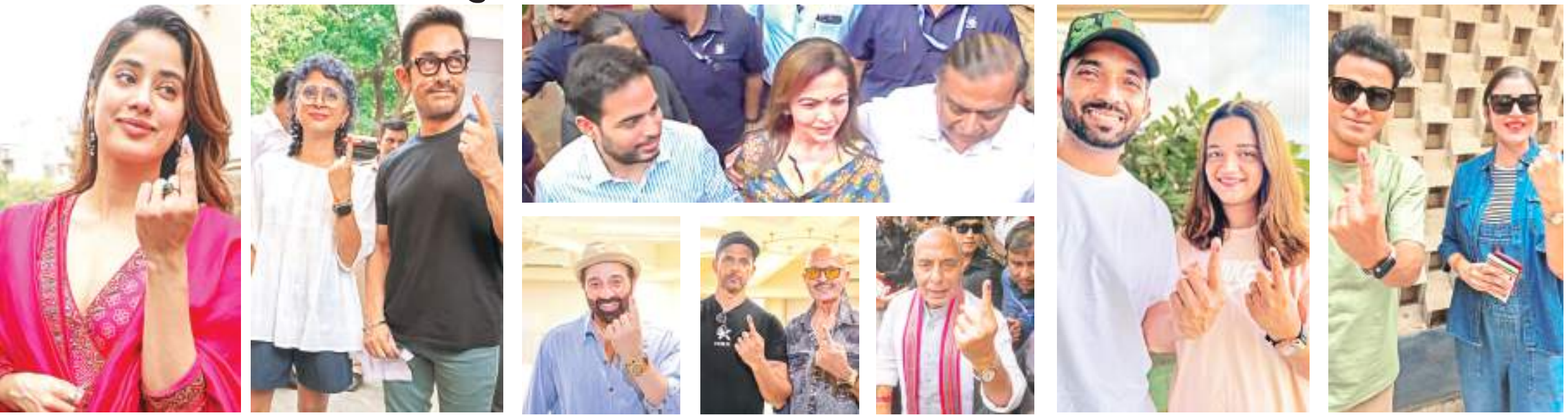
बॉलीवुड के महान कलाकार आमिर खान, सन्नी देओल, राकेश रोशन व ऋतिक रोशन, मनोज बाजपेयी, जहानवी कपूर, उद्योगपति मुकेश अंबानी, नीता अंबानी, आकाश अंबानी, केंद्रीय मंत्री राजनाथ सिंह और क्रिकेटर आज़िंक्य रहाणे ने अपनी पत्नी के साथ सोमवार को मुंबई में अपने मतदाधिकार का इस्तेमाल किया।