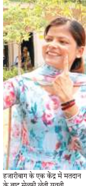
हजारीबाग के एक केंद्र में मतदान के बाद सेल्फी लेती युवती.