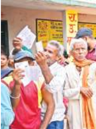
चतरा में वोट के लिए सुबह से पहुंचने लगे थे लोग.