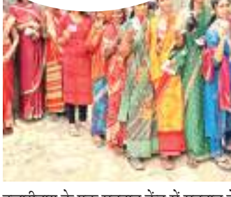
हजारीबाग के एक मतदान केंद्र में मतदान के लिए महिलाओं की कतार.