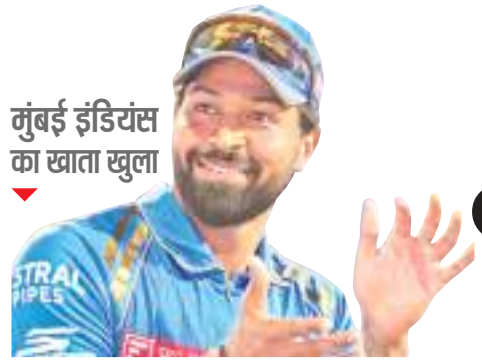
मुंबई इंडियंस का खाता खुला