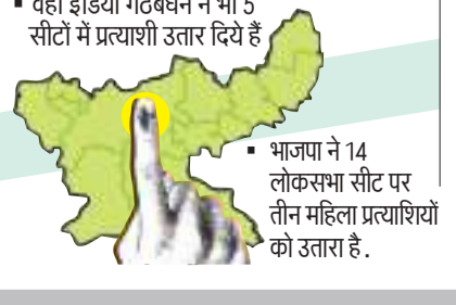
भाजपा ने 14 लोकसभा सीट पर तीन महिला प्रत्याशियों को उतारा है।