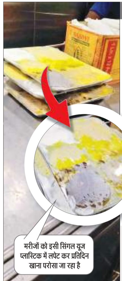
मरीजों को इसी सिंगल यूज प्लास्टिक में लपेट कर प्रतिदिन खाना परोसा जा रहा है

देश में एक तरफ सिंगल यूज प्लास्टिक पर पूर्ण प्रतिबंध है, वहीं राज्य के सबसे बड़े सरकारी अस्पताल रिमस में भर्ती मरीजों को इसी सिंगल यूज प्लास्टिक में लपेट कर प्रतिदिन खाना परोसा जा रहा है। रिमस में मरीजों को बेहतर डाइट उपलब्ध कराने के उद्देश्य से प्रबंधन ने एजेंसी को टेंडर के माध्यम से काम दिया था। इसके बाद एजेंसी ने मरीजों को खाना उनके बेड तक पहुंचाने की शुरुआत की, जिसमें मरीजों को भोजन तो विटामिन प्रोटीन वाला दिया जा रहा है, लेकिन खाना पैक करने के लिए प्लास्टिक का यूज किया जा रहा है। जो जहर से कम नहीं है। सीधे कहा जाए, तो रिमस प्रबंधन मरीजों को अच्छे भोजन के साथ जहर परोस रहा है। इससे साफ है कि मरीज अपनी बीमारी का तो इलाज करा लेंगे। लेकिन लगातार प्लास्टिक में पैक खाना खाने से उन्हें दूसरी बीमारी चपेट में ले लेंगे। अनुमानतः रिमस में करीब अलग-अलग विभागों में कुल आठ सौ के करीब मरीजों को हर रोज भोजन परोसा जाता है।