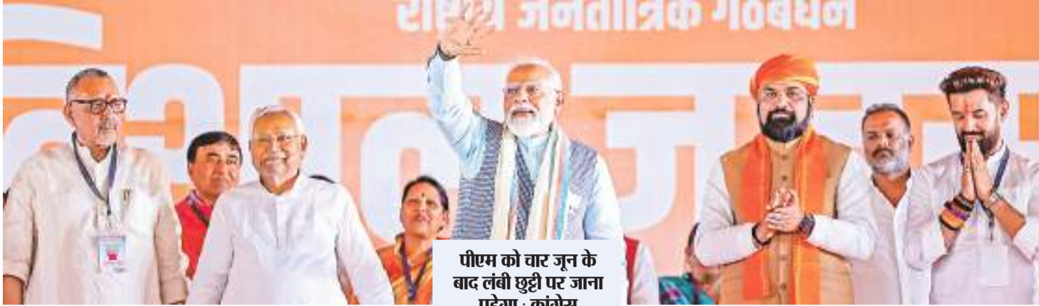
पीएम को वार जून के बाद लंबी छुट्टी पर जाना पड़ेगा : कांग्रेस

उन्होंने जम्मू-कश्मीर में बाबा साहेब आम्बेडकर के संविधान को लागू क्यों नहीं किया। यह केवल मोदी के शासन में ही संभव हो सका। घोषणा पत्र में मुस्लिम लीग के विचारों की छाप: प्रधानमंत्री ने तीन तलाक प्रथा के खिलाफ अपनी सरकार के कदम का भी जिक्र किया और कहा कि दो दिन पहले कांग्रेस ने जो अपना घोषणा पत्र जारी किया है, उसमें भी मुस्लिम लीग के विचारों की छाप है। कांग्रेस ने घोषणा पत्र नहीं, तुष्टीकरण पत्र जारी किया है। उन्होंने कहा कि मोदी ने भारत को आंध्र दिखाने वालों को सबक सिखाने की गारंटी दी थी, जो भारत को आंध्र दिखाने थे वो अब आटे के लिए भटक रहे हैं।