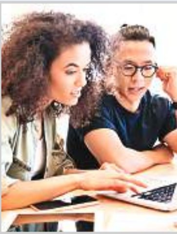
• बैचलर ऑफ ऑर्ट्स इन सोशियोलॉजी - जेंडर, वर्क एंड फेमिली • बैचलर ऑफ ऑर्ट्स इन जेंडर रैस एंड आइडेंटिटी