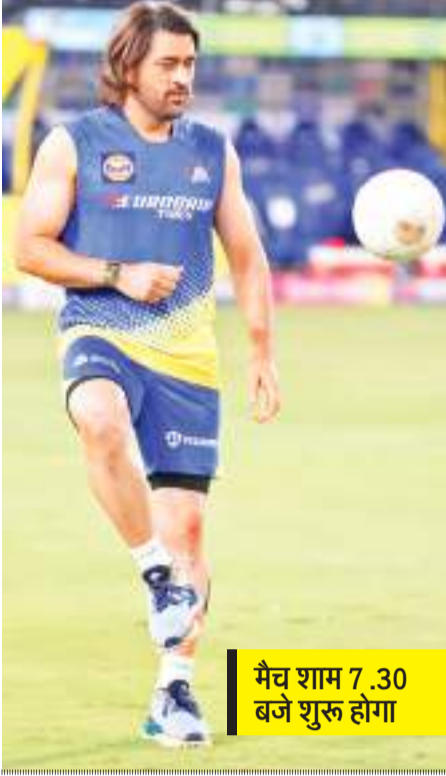
मैच शाम 7.30 बजे शुरू होगा

गेंद में 14 रन बनाए थे, लेकिन दिल्ली कैपिटल्स के खिलाफ खाता खोलने में नाकाम रहने के बाद उन्हें सनराइजर्स हैदराबाद के खिलाफ मुकाबले से बाहर कर दिया गया। तेज गेंदबाज मुस्ताफिजुर रहमान और मथीसा पथिराना विभिन्न कारणों से टीम के पिछले मैच में नहीं खेल पाए, जिससे सुपरकिंग्स के गेंदबाजी विभाग की कमजोरियां उजागर हुईं। आगर ये नाइट राइडर्स के खिलाफ मैच से भी बाहर रहते हैं तो सुपरकिंग्स को उनकी भरपाई करने के लिए कुछ अलग सोचना होगा। आगर ये दोनों बाहर रहते हैं तो तेज गेंदबाजी विभाग में दीपक चाहर, तुषार देशपांडे और मुकेश चौधरी जबकि स्पिन विभाग में मोईन अली, रविंद्र जडेजा और महेश तीक्ष्णा के कंधों पर जिम्मेदारी होगी।