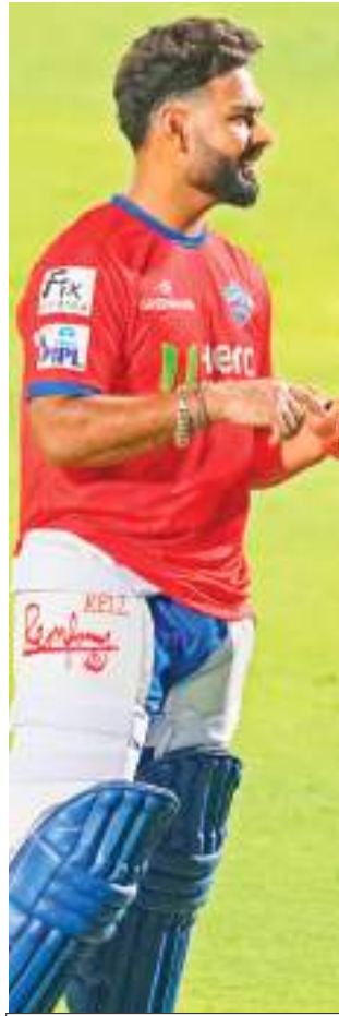
भाषा | मुंबई

तेज गेंदबाजी की सनसनी मयंक पर होगी निगाहें, जीत की हैट्रिक लगाने उतरेगा लखनऊ