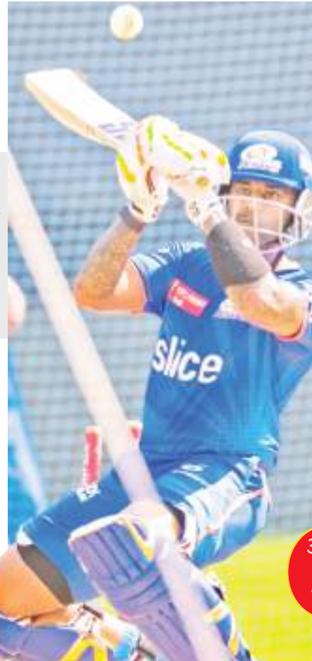
आज के मैच