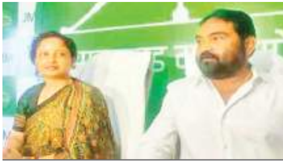
न्याय के लिए झारखंड से उलगुलान होगा

मजबूत बनाने का आह्वान करते हुए कहा कि हेमंत जी का जो सपना अपनी माटी और पार्टी को लेकर था, उसे बीच में बाधित करने का काम किया गया है। आदिवासी-मूलवासियों के लिए सरकार कर रही मजबूती से काम : कल्पना ने कहा कि झारखंड के आदिवासी और मूलवासियों को लेकर हेमंत सरकार ने मजबूती के साथ काम किया है और लगातार काम कर भी रही है। अब उस काम को हमारी सरकार आगे बढ़ाने का काम कर रही है। हेमंत सोरेन के एक साजिश के तहत विपक्ष के लोगों ने घबरा कर जेल में डाला है। उन्हें जेल बंद रखा गया है। पार्टी के कार्यकर्ताओं को ताकत से वह मजबूती के साथ संघर्ष कर रहे हैं। यही ताकत आप लोगों को न्याय उलगुलान रैली में दिखानी