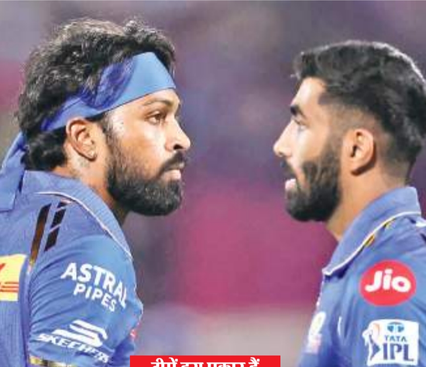
टीमें इस प्रकार हैं

ऋषभ पंत के शानदार फॉर्म और बेहतरीन कप्तानी से आत्मविश्वास से ओतप्रोत दिल्ली कैपिटल्स शनिवार को इंडियन प्रीमियर लीग में खराब फॉर्म से जूझ रही मुंबई इंडियंस से खेलेगी, तो उसका लक्ष्य जीत की लय को कायम रखने का होगा। दिल्ली कैपिटल्स ने टूर्नामेंट में टुकड़ों में अच्छा प्रदर्शन करते हुए कई मुकाबलों में शानदार जीत दर्ज की तो कई में शर्मनाक हार भी झेली। पिछले चार मैचों में से तीन जीत कर हालांकि वह अंकतालिका में छठे स्थान पर पहुंच गई और मुंबई को हराने पर प्लेआफ का उसका दावा पुष्टा हो जाएगा। दूसरी ओर खराब शुरूआत के बाद मुंबई ने अगले चार में से तीन मैच जीते लेकिन पिछले मैच में राजस्थान रॉयल्स से नौ विकेट से हार गई। अंकतालिका में आठवें स्थान पर काबिज मुंबई के लिए अब एक हार भी भारी पड़ सकती है। दिल्ली के लिए सबसे सकारात्मक बात कप्तान ऋषभ पंत का फॉर्म रही है, जो मैच दर मैच निखरते जा रहे हैं। विकेट के पीछे उनका प्रदर्शन लाजवाब रहा है और बल्लेबाजी में खुलकर खेल रहे हैं। गुजरात टाइटंस के खिलाफ बुधवार को उन्होंने मैच जिताने वाली नाबाद पायी खेली। संजू सैमसन, दिनेश कार्तिक और इशान किशन से कड़ी प्रतिस्पर्धा के बावजूद टी20 विश्व कप की टीम में उनका जगह बनाना तय लग रहा है। जैक फ्रेजर मैकराफ़ के रूप में दिल्ली को शीपक्रम का अच्छा बल्लेबाज मिला है, लेकिन सलामी बल्लेबाज पृथ्वी साव से बेहतर प्रदर्शन की उम्मीद है क्योंकि इंपैक्ट सब्स्टीट्यूट के रूप में उनकी जिम्मेदारी सिर्फ बल्लेबाजी की है। पिछले मैच में डेविड वॉरनर की जगह खेलने वाले शाई होप कोई कमाल नहीं कर सके लिहाजा आस्ट्रेलियाई