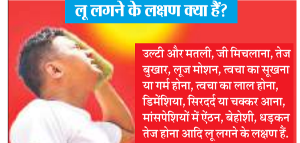
लू लगने के लक्षण क्या हैं? उल्टी और मतली, जी मिचलाना, तेज बुखार, लूज मोशन, त्वचा का सूखना या गर्म होना, त्वचा का लाल होना, डिमेंशिया, सिरदर्द या चक्कर आना, मांसपेशियों में ऐंठन, बेहोशी, धड़कन तेज होना आदि लू लगने के लक्षण हैं।