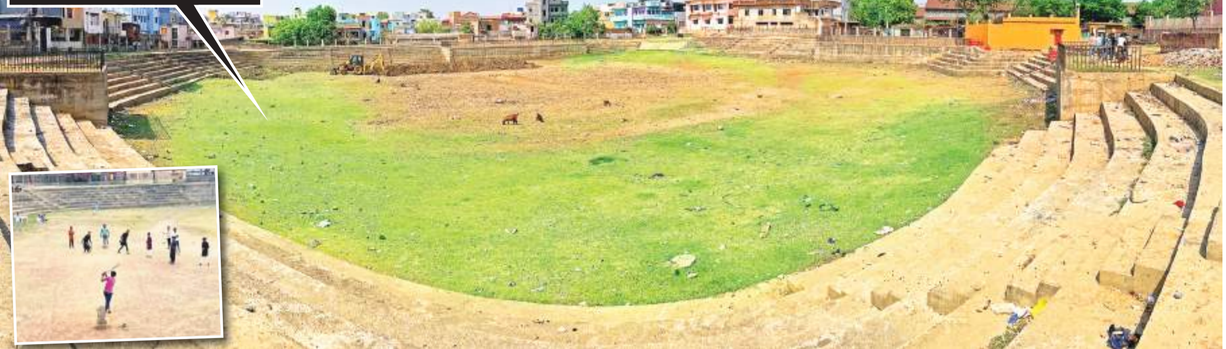
रांची। आसमान से बरस रही आग ने राजधानीवासियों का जीना मुहाल कर दिया है। भीषण गर्मी और बढ़ती तपिश के बीच कई क्षेत्रों में पानी की घोर किल्लत हो गयी है। नदी-तालाब सूख रहे हैं। इस कड़ी में रांची का कडर तालाब भी सूख कर समतल मैदान बन चुका है। अब वच्चे यहां क्रिकेट खेल रहे हैं।