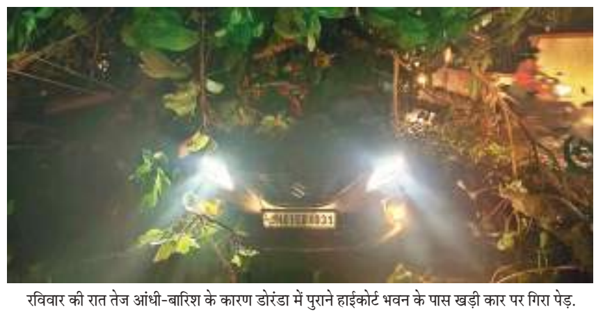
रविवार की रात तेज आंधी-बारिश के कारण डोरंडा में पुराने हाईकोर्ट भवन के पास खड़ी कार पर गिरा पेड़।

म्यूटेशन नहीं हो पाया है। हट्टुप और सुकुरहुट्टु गोशाला की भी दर्जनों समस्याएँ अबतक लंबित हैं। सदस्य