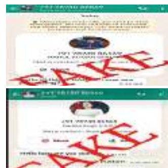
टूजैक्शन न करें और तुरंत रिपोर्ट करें। प्रशासन ने बताया है कि इस संबंध में आवश्यक कानूनी प्रक्रिया अपनायी जा रही है।