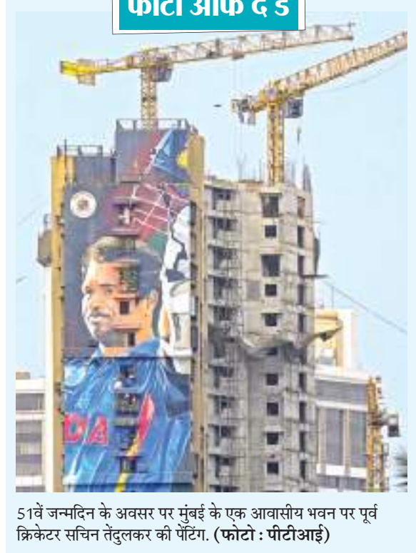
51वें जन्मदिन के अवसर पर मुंबई के एक आवासीय भवन पर पूर्व क्रिकेटर सचिन तेंदुलकर की पेंटिंग.