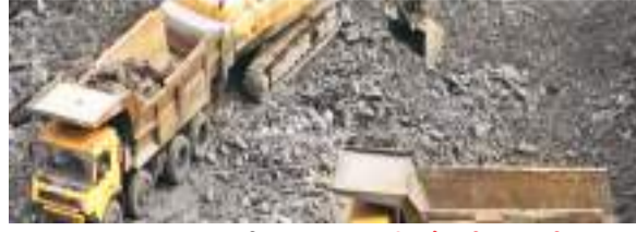
प्रमुख संवाददाता। रांची

रॉयल्टी जमा करने में पश्चिम सिंहभूम और धनबाद जिला ने रिकॉर्ड तोड़ प्रदर्शन किया है। सबसे अधिक रॉयल्टी पश्चिम सिंहभूम को मिली है। जबकि दूसरे नंबर पर धनबाद जिला है। पश्चिम सिंहभूम में विभिन्न प्रकार के खनिजों के खनन 12, 221.26 करोड़ रुपए रॉयल्टी के रूप में मिली है। दूसरे नंबर पर धनबाद जिले को 10,305.06 करोड़ रुपए रॉयल्टी के रूप में मिले हैं।