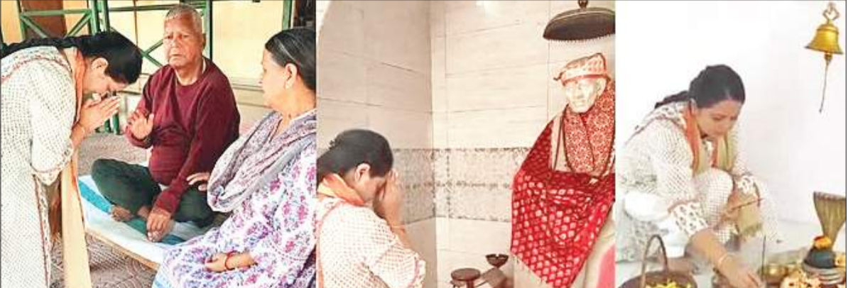
तो यह पक्का हो गया कि उन्हें इस लोकसभा चुनाव में मौका मिलेगा। अब सारण में उनका नाम पक्का हो गया है...