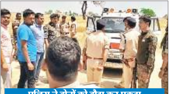
पुलिस ने दोनों को दौड़ा कर पकड़ा