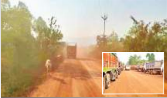
लौह ट्रैके अथवा अन्य वाहन दिखाई नहीं दे रहे हैं। इससे हमेशा दुर्घटना की संभावना बनी रहती है। स्थानीय लोगों का कहना है कि ओडिशा सीमा पर स्थित बीआरपीएल कंपनी से अयस्क ढुलाई कार्य में लगे हाईवा के परिचालन से ऐसी स्थिति उत्पन्न हो गई है। बीआरपीएल कंपनी अपना

बोकना से बड़ाजामदा एवं बड़बिल तक भारी पैमाने पर उड़ते धूलकण से पूरे क्षेत्र में प्रदूषण हो रहा है। प्रदूषण के साथ-साथ गाड़ियों के आवागमन से लगने वाले जाम से लोग काफी परेशान हैं। इससे यहां की जनता त्रस्त हो चुकी है। सबसे ज्यादा परेशानी पैदल अथवा दोपहिया वाहन से चलने वाले लोगों को ही रहती है। बड़ाजामदा सेक्टर में भारी प्रदूषण से दिन में भी अंधेरा जैसी स्थिति बनी रहती है। मुख्य सड़क से गुजरने के दौरान प्रदूषण की वजह से सांस लेना भी मुश्किल हो रहा है। लोगों को सामने से आ रही अयस्क