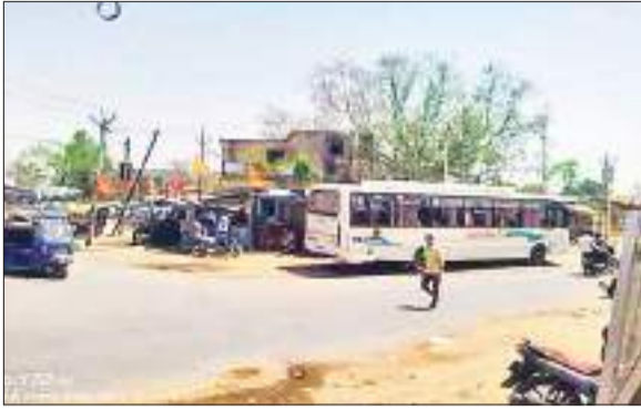
शेड है, लेकिन वो भी खंडहर में तब्दील हो चुका है। वहीं पांकी कर्पूरी

जिले का मशहूर इलाका पांकी आज भी विकास से कांसो दूर है। एक ओर जहां केंद्र और राज्य सरकार लोगों को डिजिटल इंडिया के सपने दिखा रही है। वहीं दूसरी ओर पांकी अपनी बदहाली पर आंसू बहा रहा है। अभी तक परिवहन विभाग ने यहां बस स्टैंड का निर्माण नहीं कराया है। स्टैंड नहीं होने के कारण बस सड़क पर रुकती है। जिसकी वजह से सड़क जाम हो जाता है। साथ ही यात्रियों को चिलचिलाती धूप में सड़कों पर खड़ा रहना पड़ता है। एक सरकारी यात्री