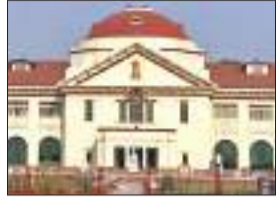
तहत अपीलीय प्राधिकार को खत्म किया गया था, उसे भी खारिज कर दिया गया है...