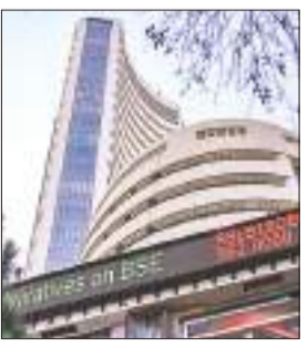
निफ्टी भी 8.70 अंक यानी 0.04 प्रतिशत की मामूली गिरावट के साथ 22,453.30 अंक पर बंद हुआ...