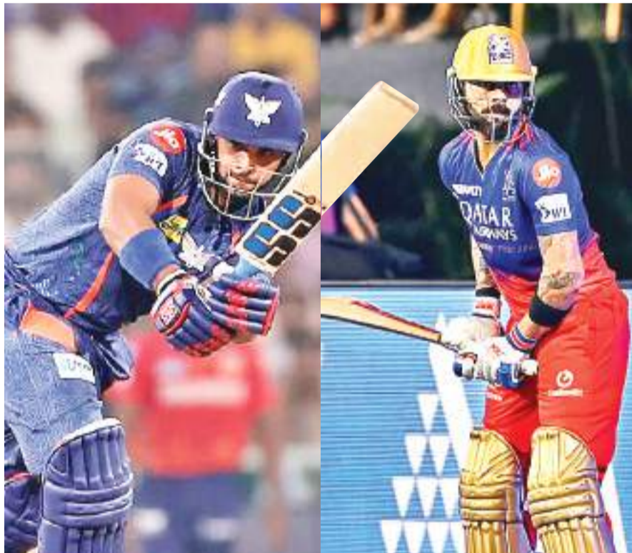
बल्लेबाजी के साथ गेंदबाजी भी आरसीबी के लिए चिंता का विषय