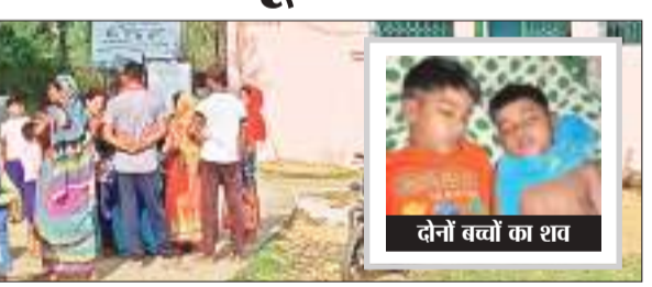
दोनों बच्चों का शव