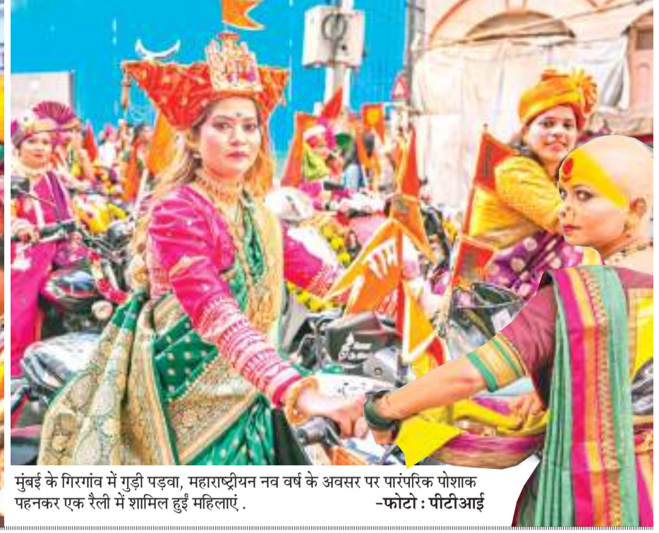
मुंबई के गिरगांव में गुड़ी पड़वा, महाराष्ट्रीयन नव वर्ष के अवसर पर पारंपरिक पोशाक पहनकर एक रैली में शामिल हुई महिलाएं