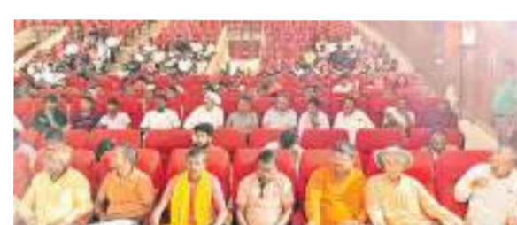
आम नागरिक किसी भी प्रकार की अफवाहों पर ध्यान नहीं दें