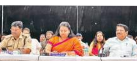
आम नागरिक किसी भी प्रकार की अफवाहों पर ध्यान नहीं दें

आगामी रामनवमी व ईद के दौरान सांप्रदायिक सौहार्द बनी रहे, भाईचारा के साथ व्यवस्थित तरीके से गरिमामय माहौल में आयोजन के लिए जिला स्तरीय शांति समिति की बैठक मंगलवार को को नगर भवन सभागार में संपन्न हुई। उपायुक्त नैसी सहाय की अध्यक्षता में आयोजित इस बैठक में जिले भर के शांति समिति के सदस्य शामिल हुए, उपायुक्त ने कहा कि पर्व व त्योहारों के मौसम के बीच राज्य में लोकसभा निर्वाचन को लेकर आदर्श आचार संहिता भी प्रभावी है, जिसका उल्लंघन न हो। साथ ही विधि व्यवस्था एवं सांप्रदायिक समुदाय की भावना, नागरिक सुविधाओं को दिलाने के लिए कृतसंकल्पित है। पुलिस द्वारा सुरक्षा व्यवस्था और असाामाजिक तत्वों से निपटने के लिए पर्याप्त संख्या में पुलिस बल की तैनाती की जाएगी। असाामाजिक तत्वों के गतिविधियों पर निगरानी रख रही है। अतिरिक्त सुरक्षा व्यवस्था के लिए ड्रोन कैमरा, सीसीटीवी कैमरा का उपयोग किया जाएगा। शहर में सड़कों एवं मकान की छत पर ईंट, पत्थर जमा कर रखने वाले की जांच शुरू कर की गयी है। उन्होंने कहा कि आम नागरिक किसी भी प्रकार की अफवाहों पर ध्यान नहीं दें, किसी भी प्रकार के सोशल मीडिया पोस्ट की संख्या को परख लें। पुलिस की आईटी सेल भ्रामक पोस्ट के माध्यम से सांप्रदायिक सौहार्द बिगाड़ने वाले लोगों पर पनी नजर बनाए रखी है।