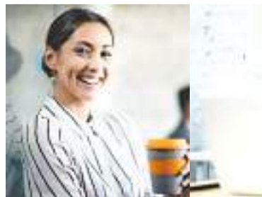
संयोजन - वेतना झा, डिजाइनिंग - खुशबू कुमारी

आखिर चूक कहाँ हो रही है। मन में जो तनाव चल रहा है, उसे कभी एकांत में कागज के पन्नों पर लिखें। पहले यह खुद मानें कि आपके अंदर जो काबलियत है कि आप किसी भी काम को बेस्ट तरीके से कर सकते हैं। इसके बाद एक रूपरेखा बनाएं कि आपको आगे कैसे काम करना है। यकी मानिए, खुद की गई यह कोशिश जरूर कोई नतीजा देगी। • मल्टीटास्किंग से बचें : हम महिलाओं की एक खासियत मल्टीटास्किंग होना है, लेकिन कई बार यही खासियत हमें परेशानी में दे देती है और कई बार काम की गुणवत्ता पर सवाल खड़े करती है। इसलिए बेहद जरूरी है कि, जो काम करें वो अच्छे से करें। इसलिए काम उतना ही अपने हाथ में लें, जितने को आप बेहतर तरीके से तय समय में निपटा सकें। जहाँ जरूरी हो, वहाँ ना कहना सीखें।