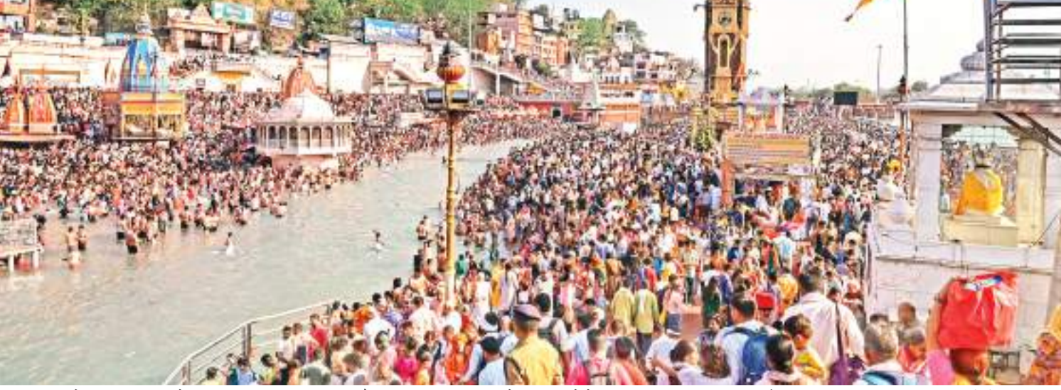
हर हर गंगे: सोमवती अमावस्या के अवसर पर हरिद्वार की हर की पौड़ी पर पतित पावनी गंगा में स्नान करने के लिए श्रद्धालुओं का उमड़ा जनसैलाब.