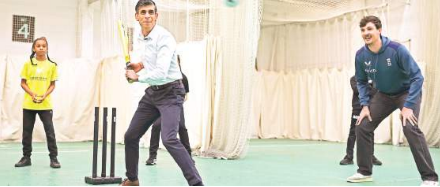
ब्रिटेन के प्रधानमंत्री रक्षि सुनक ने शुक्रवार को दक्षिण लंदन के ओवल क्रिकेट मैदान में क्रिकेट अभ्यास सत्र में भाग लिया।

इदल्लिब (सीरिया)। उत्तर-पश्चिमी सीरिया में गुरुवार देर रात एक आत्मघाती हमलावर द्वारा किए गए विस्फोट में, आतंकवादी संगठन अल-कायदा से जुड़े समूह के सीरियाई सह-संस्थापक की मौत हो गई। एक युद्ध निगरानीकर्ता ने यह जानकारी दी। कुछ कार्यकर्ताओं ने बताया कि बम विस्फोट में अबू मारिया अल-कहतानी की मौत हो गई। अबू मारिया अल-कहतानी को अरसली नाम मयसारा अल-दुबारी था। अल-कहतानी सीरिया में नुसरा फ्रंट का सह-संस्थापक था।