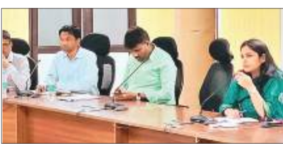
जिला निर्वाचन पदाधिकारी सह उपायुक्त माधवी मिश्रा की अध्यक्षता में गुरुवार को समाहरणालय स्थित सभागार में लोकसभा चुनाव को लेकर विभिन्न बैंकों के प्रतिनिधियों के साथ बैठक की गई।

उपायुक्त ने यह भी कहा कि विभिन्न बैंकों के एटीएम मशीन में नगद राशि जमा करने वाले एटीएम बैंक में सभी संबंधित महत्वपूर्ण दस्तावेज व आईडी कार्ड को वाहन में साथ रखें ताकि किसी प्रकार के जांच के क्रम में स्थिति स्पष्ट हो सके। साथ ही आदर्श आचार संहिता का उल्लंघन न हो, इस पर भी विशेष ध्यान रखें। उन्होंने कहा कि लोकसभा आम चुनाव के परिप्रेक्ष्य में निर्वाचन व्यव अनुवीक्षण के अधीन निर्वाचन प्रक्रिया स्वच्छ बनाये रखने के लिए बैंकों के स्तर से संदेहास्पद नगदी