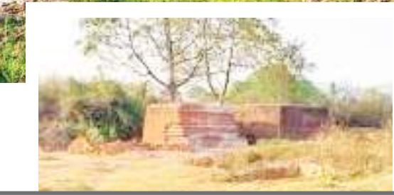
कभी कतरी नदी से मिलता था पीने का पानी