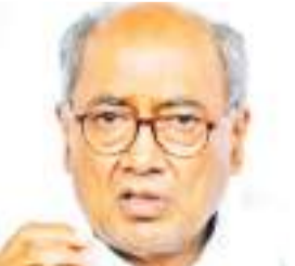
सिंह ने कहा कि शाह ने 17 बार उनका नाम लिया और आठ बार उनके बारे में झूठ बोला