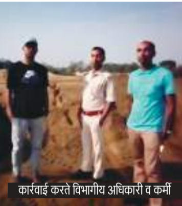
कार्रवाई करते विभागीय अधिकारी व कर्मियों

में भी अवैध भंडारण किए गए जमीन के मालिक का पता लगाया जा रहा है। उन्होंने बताया कि उसके पूर्व ईचगढ़ में जब्त किये गए 10 लाख सीएफटी से अधिक बालू का भी नीलामी की जाएगी।