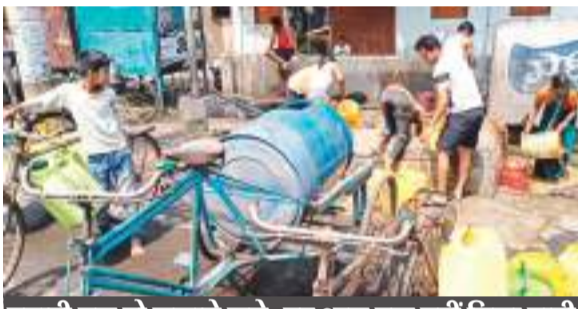
चुनावी नल तो लगाये गये, पर आज तक नहीं मिला पानी

इससे के लोगों में जनप्रतिनिधियों के प्रति भारी आक्रोश है। वैसे तो इस टोला में जनप्रतिनिधियों के द्वारा दो-चार सार्वजनिक नल लगाये गये हैं। लेकिन इस नल से पानी कब गिरेगा, इसकी जानकारी यहां के लोगों को नहीं है। यही वजह है इस नल से पानी आने का इंतजार करने के बजाय यहां के लोग तीन रुपये प्रति गैलन पानी खरीदना ही मुनासिब समझते हैं।