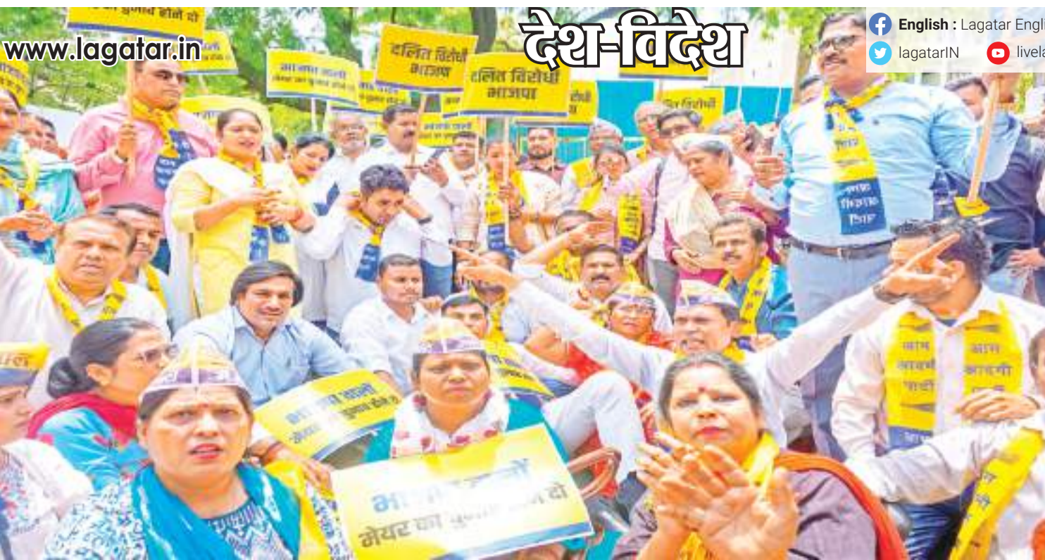
आम आदमी पार्टी (आप) के कार्यकर्ताओं ने शनिवार को नई दिल्ली में भाजपा के खिलाफ विरोध-प्रदर्शन करतीं.