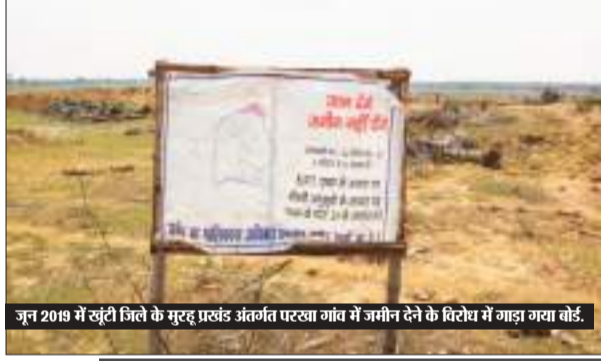
जून 2019 में खूंटी जिले के मुरह प्रखंड अंतर्गत परत्या गांव में जमीन देने के विरोध में गाड़ गया बोर्ड।

लैंड बैंक की जमीन जल्द मुक्त करेगी सरकार : कांग्रेस