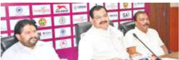
महिला हांकी लीग गेमचेर साबित होगी

राष्ट्रीय महिला हांकी लीग न केवल महिला हांकी के लिए बार बढ़ाकर बल्कि आने वाली पीढ़ियों को प्रेरित करेगी भी एक गेम-चेंजर बनने का वादा करती है। यह प्रतियोगिता राष्ट्रीय टीम के लिए प्रतिभाओं की पहचान और पोषण के लिए एक महत्वपूर्ण मंच के रूप में भी काम करेगी।