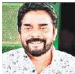
प्रमुख संवाददाता। रांची