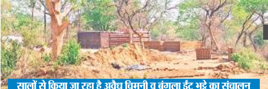
सालों से किया जा रहा है अवैध विमनी व बंगला ईंट भट्टे का संचालन

बाघमारा और कतरास के इलाकों में भी अवैध ईंट भट्टों का संचालन बेखौफ हो रहा है. यहां दर्जनों की संख्या में अवैध ईंट भट्टे चल रहे हैं. बाघमारा की मिट्टी बेहतर होने के कारण यहां की ईंटों की काफी डिमांड है. इस कारण यहां भट्टों का संचालन अन्य क्षेत्रों से कहीं अधिक है. इन ईंट भट्टों में महकमा की लापरवाही और रिश्वतखोरी का ईंधन डालकर यहां खूब ईंटें पकाई जा रही हैं. सिर्फ कतरास, बाघमारा ही नहीं, बल्कि पूरे जिले में यहां के भट्टों में पकी ईंटें बिकने के लिए पहुंच रही हैं.