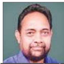
चार तिस सीटों पर है झामुमो का कब्जा

लोकसभा क्षेत्र में बहरागोड़ा, घाटशिला, पोटाका, जुगसलाई, जमशेदपुर पूर्वी और जमशेदपुर पश्चिमी विधानसभा सीटें शामिल हैं। इन छह विधानसभा सीटों में से 4 पर झामुमो, एक पर कांग्रेस और एक पर निर्दलीय विधायक हैं। जमशेदपुर लोकसभा सीट पर 1957 से अब तक 18 बार चुनाव हुए हैं जिसमें 6 बार बीजेपी और 11 बार दूसरे दलों ने जीत दर्ज की है। 2004 में झारखंड युक्ति मोर्चा के सुनील महतो और 2007 के उपचुनाव में सुमन महतो यहां से सांसद चुने गए। 2011 में हुए उपचुनाव में झारखंड विकास मोर्चा के अजय कुमार ने इस सीट पर कब्जा जमाया। इसके बाद 2014 और 2019 के चुनावों में यहां से बीजेपी के विद्युत वरण महतो लगातार दो बार सांसद चुने गए।