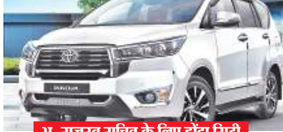
भू-राजस्व सचिव के लिए होंडा सिटी

झारखंड सरकार की प्रशासनिक कमेटी ने कार खरीदारी की दी मंजूरी