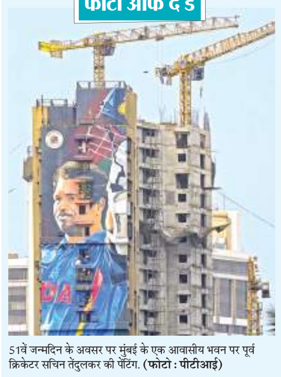
51वें जन्मदिन के अवसर पर मुंबई के एक आवासीय भवन पर पूर्व क्रिकेटर सचिन तेंदुलकर की पेंटिंग.