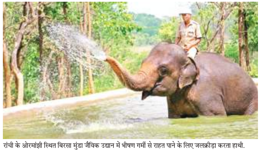
रांची के ओरमांडी स्थित बिरसा मुंडा जैविक उद्यान में भीषण गर्मी से राहत पाने के लिए जलक्रीड़ा करता हाथी।