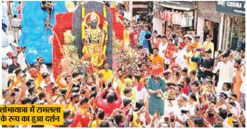
शोभायात्रा में रामलला के रूप का हुआ दर्शन

पटना। पटना के महावीर मंदिर में बड़ा हादसा टल गया। महाआरती के दौरान गर्भ गृह के बाहर आग लग गई। यह आग फूलों की सजावट में लगी थी। हालांकि, समय रहते आग पर काबू पा लिया गया। इस दौरान मंदिर में दो सौ से ज्यादा लोग मौजूद थे। बता दें कि रामनवमी को लेकर मंगलवार मध्य रात्रि से महावीर मंदिर में दर्शन के लिए भीड़ उमड़ पड़ी थी।