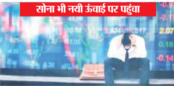
सोना भी नयी ऊंचाई पर पहुंचा

राजन ने यहां जॉर्ज वाशिंगटन विश्वविद्यालय में '2047 तक भारत को एक उन्नत अर्थव्यवस्था बनाना: इसके लिए क्या करना होगा' विषय