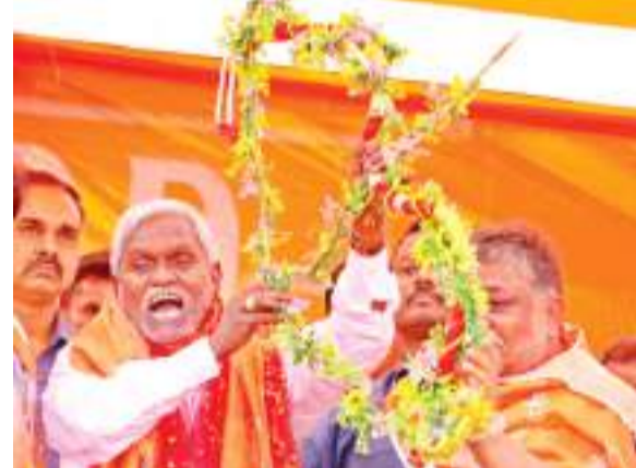
रामनवमी की जुलूस में शामिल हुए मुख्यमंत्री चंपाई सोरेन.

रामनवमी यानि भगवान श्रीराम का जन्मोत्सव. अयोध्या में भगवान श्री राम के मंदिर निर्माण और वहां राम लला की प्राण प्रतिष्ठा की वजह से इस साल लोगों में दोहरा उत्साह था. पूरा राज्य राममय हो गया. एक ओर जहां मंदिरों में अहले सुबह से पूजन-अनुष्ठान का कार्यक्रम चलता रहा, वहीं राज्य के शहर से लेकर गांवों तक की मुख्य सड़कों से लेकर गली-मुहल्लों तक में भगवान श्री राम और बजरंगबली के जयकारे लगते रहे. मंदिरों में जहां भगवान की पूजा-अर्चना होती रही, वहीं परंपरागत हथियारों को भी पूजा गया. रामनवमी की शोभायात्रा में बड़ी-बड़ी लाल-पीला, हरा-नीला महावीर पतकाएं लहरा रही थीं. बैंड और ताशा की धुन पर बच्चे, युवा, महिलाओं के साथ-साथ बुजुर्गों के थिरकते पांव, परंपरागत हथियार चलाने के युवाओं के हैरतअंगेज करतब देख लोगों ने दौतों तले ऊंगलियां दबा लीं. राज्य भर में रामनवमी के मौके पर आकर्षक झांकियां निकाली गयीं. कहीं अयोध्या के श्रीराम मंदिर की झांकी के साथ शोभायात्रा निकाली गयी, तो कहीं वीर हनुमान, भगवान शंकर, पार्वती की जीवंत झांकी दिखी. शोभा यात्रा में अखाड़े के युवा से लेकर बुजुर्ग सदस्य तक परंपरागत हथियार चलाने का प्रदर्शन कर रहे थे.