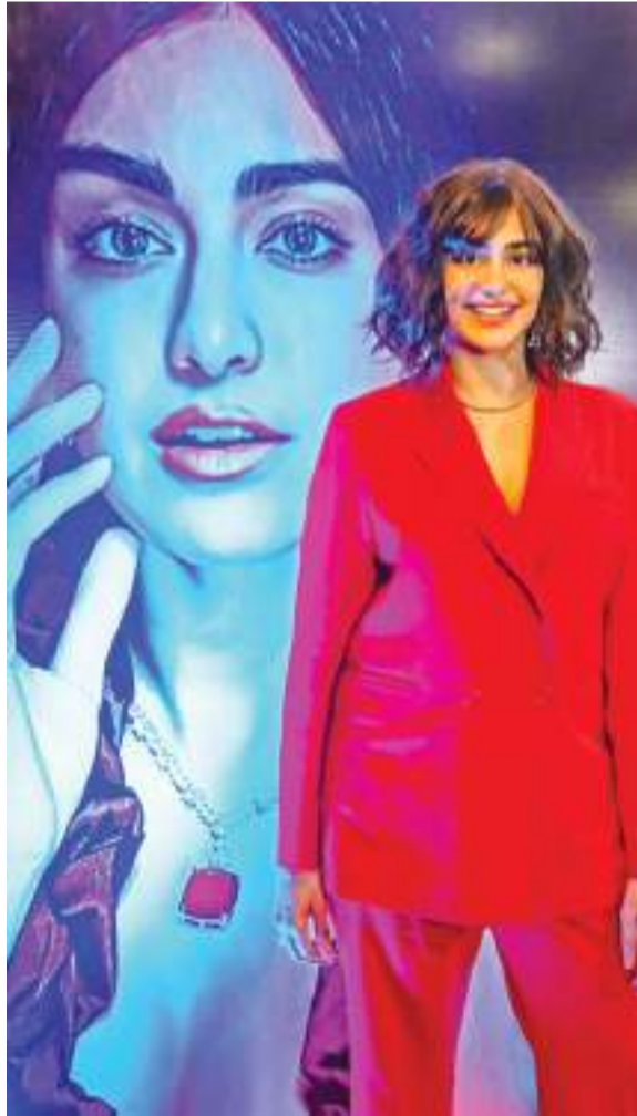
बुधवार को कोलकाता में एक प्रचार कार्यक्रम के दौरान अभिनेत्री अदा शर्मा।

आंकड़ों के अनुसार, मार्च तक उपभोक्ता कीमतों में 3.2 प्रतिशत की वृद्धि हुई, जो सितंबर 2021 के बाद यह सबसे कम है। फरवरी में यह 3.4 प्रतिशत से कम थी। हालांकि वार्षिक दर में गिरावट अर्थशास्त्रियों के अनुमान के मुताबिक नहीं है जिन्होंने इसके मार्च में 3.1 प्रतिशत रहने की संभावना जतायी थी। मुद्रास्फीति अब भी बैंक ऑफ इंग्लैंड के दो प्रतिशत के लक्ष्य से ऊपर बनी हुई है। यूक्रेन पर रूस के आक्रमण के बाद ऊर्जा लागत में तेज वृद्धि के कारण 2022 के अंत में मुद्रास्फीति 11 प्रतिशत से ऊपर पहुंच गई थी।