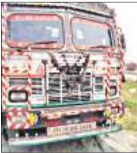
अवैध कोयला लदा ट्रक।