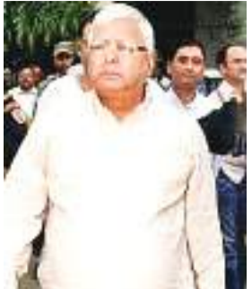
उन्होंने सबाल किया, ये भाजपा वाले चाहते क्या हैं? इन्हें संविधान, दलितों, पिछड़ों, आदिवासियों और