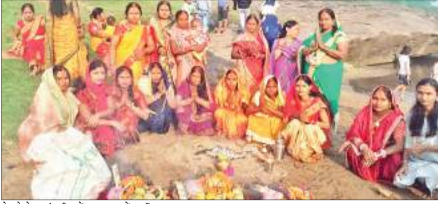
बेरमो के जारंगडीह में छठ पूजा में उपस्थित श्रद्धालु।

शाम को अस्ताचलगामी भगवान भास्कर को छठव्रतियों ने अर्घ्य दिया