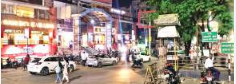
वारदात नंबर -3 स्थान - सर्किट हाउस के समीप समय - लगभग 8 बजे पीड़िता : ज्योत्सना सिंह