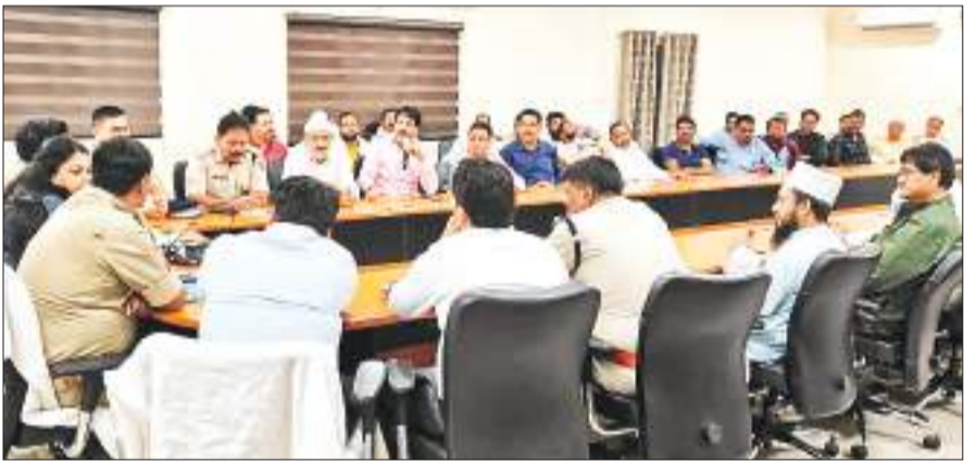
रामनवमी में डीजे बजाने की अखाड़ों की मांग पर आज फैसला लेगा प्रशासन