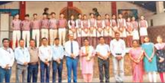
डीएवी स्कूल में कार्यक्रम में मौजूद छात्र-छात्राएं व शिक्षक।

बोकारो के कथारा स्थित डीएवी स्कूल में सोमवार को विद्यालय के वार्षिक सह पाठ्यक्रम गतिविधियों के परिणाम घोषित किए गए। बच्चों के सर्वांगीण विकास तथा विभिन्न कौशलों को निखारने व प्रखर बनाने के लिए वर्ष भर में अनेक अंतरीय सदन प्रतियोगिताओं का आयोजन किया गया। सांस्कृतिक कौशल, संचारी कौशल, भाषा कौशल और बच्चों के कलात्मक कौशल को बेहतर बनाने के लिए विभिन्न बहुआयामी प्रतियोगिताओं का आयोजन होता रहा। इस दौरान नृत्य, गीत, प्रश्नोत्तरी,