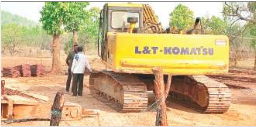
गोमिया में कार्यस्थल पर मौजूद जेसीबी.

बेरमो अनुमंडल क्षेत्र के उग्रवाद प्रभावित चतरोचट्टी थाना क्षेत्र में बीती रात नक्सलियों द्वारा पुल निर्माण में लगे एक जेसीबी मशीन के चालक की पिटाई का मामला सामने आया है। घटना के संबंध में मिली जानकारी के अनुसार घटना 11 अप्रैल की रात की है। बता दें कि चतरोचट्टी थाना क्षेत्र अंतर्गत बड़की सीधावारा पंचायत के खखंडी गांव के समीप मौलियानाला में पुल का निर्माण किया जा रहा है। गुरुवार की रात लगभग नौ बजे नक्सलियों का जत्था हथियारों से लैस होकर उक्त पुल के निकट पहुंचा और काम करा रहे मंशी को खोजने लगा। उस समय मंशी वहां मौजूद नहीं था। कार्यस्थल पर जेसीबी मशीन का चालक था। नक्सलियों ने चालक को मंशी से बात करने को कहा। चालक ने मंशी का नंबर नहीं होने की बात कही, तो उसके साथ मारपीट की गई। इसके बाद नक्सलियों ने धमकी दी और चले गए। नक्सलियों की संख्या सात से आठ के करीब थी।