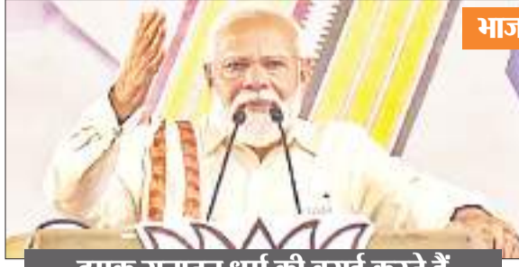
द्रमुक सनातन धर्म की बुराई करते हैं

प्रधानमंत्री नरेंद्र मोदी ने कच्चातित्व मुद्दे पर बुधवार को कांग्रेस और उसकी सहयोगी द्रविड़ मुनेत्र कणम (द्रमुक) पर तीखा हमला बोला और आरोप लगाया कि दोनों दलों ने इस मुद्दे पर 'देश को अंधेरे' में रखा। 'शक्ति' को लेकर की गई टिप्पणी के लिए भी उन्होंने कांग्रेस पर निशाना साधते हुए उसपर महिलाओं के अपमान का आरोप लगाया। उन्होंने भ्रष्टाचार के मुद्दे पर भी द्रमुक पर निशाना साधा और कहा कि इस मुद्दे पर 'पहला कॉपीराइट' सत्तारूढ़ पार्टी के पास है तथा मुख्यमंत्री एम के स्टालिन के 'परिवार' का इरादा राज्य को 'लूटने' का है। राज्य में 19 अप्रैल को होने वाले लोकसभा चुनाव के लिए राजग के उम्मीदवारों के पक्ष में प्रचार करते हुए उन्होंने यहां एक चुनावी रैली में कहा, भ्रष्टाचार पर द्रमुक का पहला कॉपीराइट है, पूरा परिवार तमिलनाडु को लूट रहा है। उन्होंने द्रमुक पर 'एक परिवारिक कंपनी' होने का आरोप लगाया, जो राज्य के युवाओं की 'पुरानी मानसिकता' के साथ प्रगति में