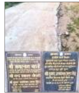
जांव की मांग की थी

बेरमो प्रखंड में विकास कार्य में गड़बड़ी की बानगी देखनी है तो जारंगडीह आइए, झारखंड सरकार द्वारा बेरमो विधायक की अनुशंसा पर जारंगडीह मोड़ से सीसीएल कॉलोनी होते हुए दामोदर नदी तक पथ सुदृढ़ीकरण का कार्य ग्रामीण कार्य विभाग द्वारा किया जा रहा है, जिस सड़क निर्माण का कार्य अभी पूर्ण भी नहीं हुआ, वहीं सड़क अब टूटने लगी है। सड़क पर दिख रही दरारों से भ्रष्टाचार झांक रही है। इस नव निर्मित सड़क का टूटना और सड़क पर दिखाई दे रही दरारों की तस्वीर देख सहज ही अनुमान लगाया जा सकता है कि किस तरह से सड़क निर्माण कार्यों में गुणवत्ता को ताक पर रखकर संवेदक ने निर्माण किया गया होगा। बताते चलें कि सड़क निर्माण के दौरान ही सड़क निर्माण में बरती जा रही अनियमितता तथा गुणवत्ता के अनुरूप कार्य होता न देख स्थानीय ग्रामीणों ने विभाग को मामले से अवगत कराया था।