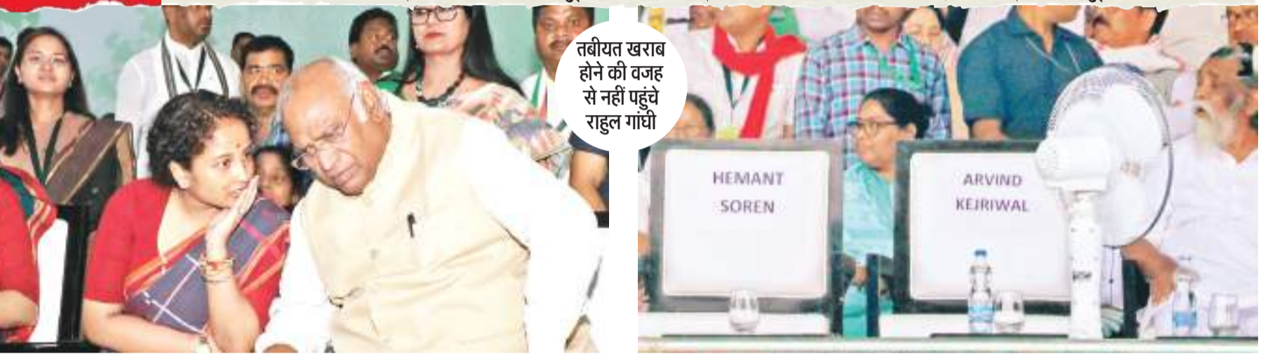
रांची के प्रभात तारा मैदान में महारैली के दौरान कल्पना सोरेन से गुप्तगू करते मल्लिकार्जुन खरगे।

‘इंडिया’ के नेताओं ने कहा ■ भगवान राम को बेच रही है बीजेपी ■ तुम तो धोखेबाज हो वादा कर भूल जाते हो ■ वोट के लिए आदिवासी को बनाया था राष्ट्रपति ■ पीएम नरेंद्र मोदी हैं झूठों के सरदार