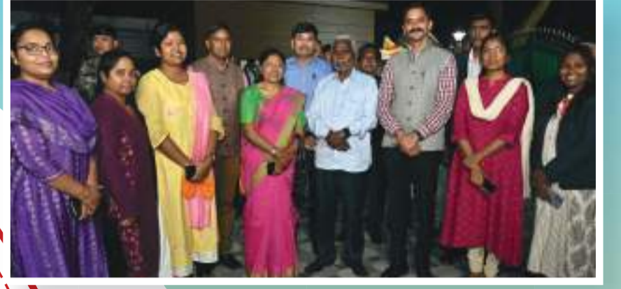
शिशु देखभाल अवकाश योजना लागू होने के बाद मुख्यमंत्री चंपाई सोरेन को धन्यवाद ज्ञापित करते अधिकारीगण