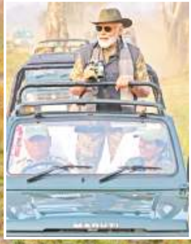
शनिवार की सुबह असम के काजीरंगा राष्ट्रीय उद्यान एवं बाघ अभयारण्य में हाथी की सवारी करते पीएम मोदी. इस दौरान उन्होंने जीप सफारी का भी लुप्त उठाया.