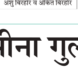
अशु बिरहोर व अंकित बिरहोर