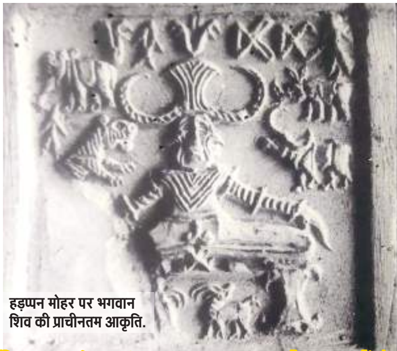
हड़प्पन मोहर पर भगवान शिव की प्राचीनतम आकृति.

झारखंड में भी शिव पूजा की परंपरा अनादि काल से चली आ रही है और आज झारखंड के अंदरूनी हिस्सों में जब भी यात्रा करेंगे तो गांव-गांव में शिवलिंगों की भरमार दिखाई देगी। जगह-जगह प्राचीन शिव मंदिरों के, मूर्तियों के अवशेष, विभिन्न मुद्राओं में शिव पार्वती की मूर्तियां तथा बड़ी संख्या में शिवलिंग आदि बिखरे पड़े दिखते हैं। विशेष कर खूंटी जिले में एक महादेव मंडा है जहां लगभग 40-50 प्राचीन शिवलिंग दिखते हैं। इसी प्रकार गुमला जिला के अंजनधाम में भी शिवलिंगों की भरमार है। प्राचीन शिव मंदिर भी झारखंड में सैकड़ों की संख्या में पाए गए हैं, यथा; हरदोडी, हरिन, देवड़ी, बेनुसागर, टांगीनाथ, खकपरता, देवघर, दुलमी, इटखोरी, उपचुड़िया, अखिलेश्वर, चित्रेश्वर, खुखरागढ़, इचागढ़, महादानी आदि के नामों से विख्यात हैं, जहां महाशिवरात्रि पर बड़े-बड़े मेले लगते हैं। इस प्रकार, झारखंड के आदिवासी समाज में भी शिव की पूजा लगातार होती आई है, आज भी होती है और