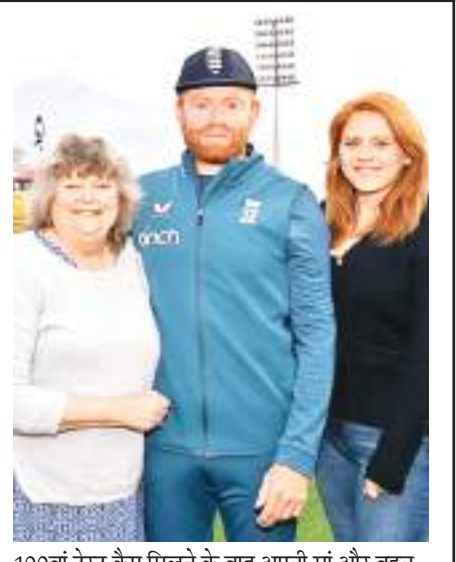
100वां टेस्ट कैप मिलने के बाद अपनी मां और बहन के साथ भावुक हुए बेयरस्टो.

राहुल द्रविड़ से 100वां टेस्ट कैप प्राप्त करने के बाद अश्विन ने कहा कि टेस्ट क्रिकेट जीवन के सबसे करीब है. आईपीएल एक बेहद लोकप्रिय टूर्नामेंट रहा है, बहुत सारे बच्चे टी-20 खेलना और आईपीएल में जाना चाहते हैं. मैं सचमुच चाहता हूँ कि वे वहां पहुंचें, लेकिन एक बात याद रखें, यह प्रारूप (टेस्ट)... यह कई चीजों में है जो जीवन आपको नहीं सिखाएगा. उन्होंने कहा कि मुझे लगता है कि टेस्ट क्रिकेट ही जीवन है.