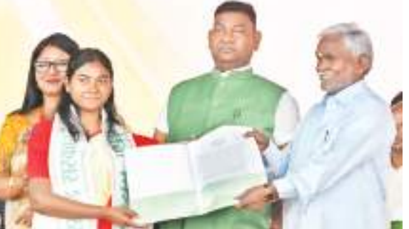
रांची में आयोजित कार्यक्रम में नियुक्ति पत्र देने सीएम चंपाई सोरेन।

मुख्यमंत्री चंपाई सोरेन ने कहा कि आने वाले 3 से 4 महीनों में 30 हजार रिक्त पदों को भरा जाएगा। यह घोषणा गुरुवार को सीएम चंपाई सोरेन ने 2454 अभ्यर्थियों को नियुक्ति पत्र देने के दौरान किया। मौके पर सीएम द्वारा स्नातकोत्तर प्रशिक्षित शिक्षक (पीजीटी) बायोर्लॉजी के 253, केमिस्ट्री के 259, फिजिक्स के 313 और भूगोल के 195 अभ्यर्थियों को नियुक्ति पत्र मिला। वहीं, नगर विकास और आवास विभाग के पाइपलाइन इंस्पेक्टर के लिए 15, स्ट्रीट लाइट इंस्पेक्टर के 55 अभ्यर्थियों को नियुक्ति पत्र दिया गया। कृषि विभाग के कर्मीय अभियंता के 9 अभ्यर्थियों को नियुक्ति पत्र दिया गया है। खान निरीक्षक के 34 अभ्यर्थी हैं। विद्युत विभाग के कर्मीय अभियंता के 53 और पथ निर्माण विभाग, पेयजल एवं स्वच्छता विभाग, नगर विकास एवं आवास विभाग के 1268 सिविल अभियंता को नियुक्ति पत्र दिया गया। राज्यसभा सांसद महुआ माजी, प्रधान सचिव सुनील कुमार, सचिव प्रशांत कुमार, राजेश शर्मा, सचिव अबू बकर सिद्दीकी, सचिव अरवा राजकमल, सचिव उमाशंकर सिंह, निदेशक शशि रंजन समेत अन्य शामिल रहे।