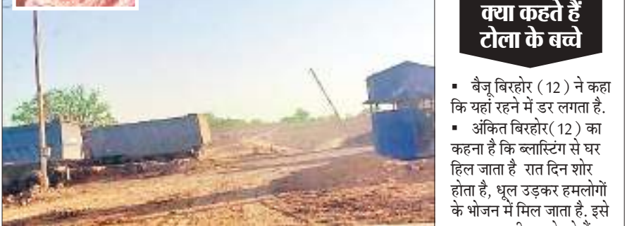
खदान से होकर इसी रास्ते से बिरहोर परिवार बाजार आते-जाते हैं।