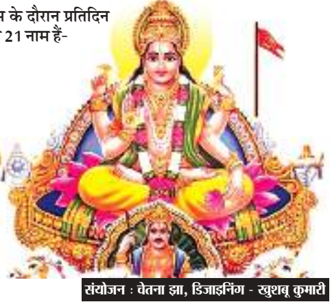
संयोजन : चेतना झा, डिजाइनिंग - खुशवंत कुमारी