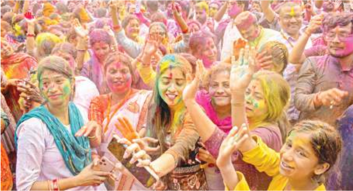
गोरखपुर में आयोजित होली मिलन समारोह के दौरान लोगों ने जमकर अबीर-गुलाल उड़ाये। वहीं दूसरी ओर भारत-पाकिस्तान सीमा पर होली मिलन समारोह के दौरान एक-दूसरे को अबीर-गुलाल लगा कर खहोली की खुशियां मनाती महिला जवान।

वाशिंगटन। अमेरिका के राष्ट्रपति जो बाइडन और पूर्व राष्ट्रपति डोनाल्ड ट्रंप ने देश में होने वाले राष्ट्रपति पद के चुनाव के लिए क्रमशः डेमोक्रेटिक और रिपब्लिकन पार्टी का उम्मीदवार चुने जाने की प्रक्रिया के तहत लुइसियाना के प्राइमरी चुनाव में शनिवार को जीत हासिल कर ली। बहरहाल, ट्रंप और बाइडन दोनों का ही राष्ट्रपति पद के चुनाव के लिए अपनी-अपनी पार्टी का उम्मीदवार बनना तय हो चुका है। बाइडन ने मिसौरी के डेमोक्रेटिक प्राइमरी का भी चुनाव लड़ा।