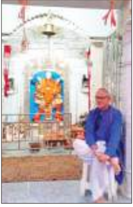
गाजे-बाजे के साथ महावीरी पताका लेकर झूम कर निकलेगे। हरवे-

होली के साथ-साथ मंगलवार को राजधानी श्रीराम और हनुमान जी की भक्ति से भी सरोबार रहेगी। इस बार फववा के दिन ही प्रथम मंगलवारी जुलूस भी निकाला जायेगा। इसको लेकर श्रीमहावीर मंडल रांची सहित विभिन्न मंडलों और अखाड़ाधारियों ने पूरी तैयारी कर रखी है। दिनभर रंग-गुलाल के साथ होली की मस्ती छाये रहेगी, वहीं सांझ ढलते उड़ते अबीर-गुलाल के साथ श्रीराम और हनुमान जी के जयकारे भी गुंजेगे। इसी के साथ रामनवमी महोत्सव का शुभारंभ भी हो जायेगा। शाम सात बजे के बाद श्रद्धालु अपने अखाड़े से