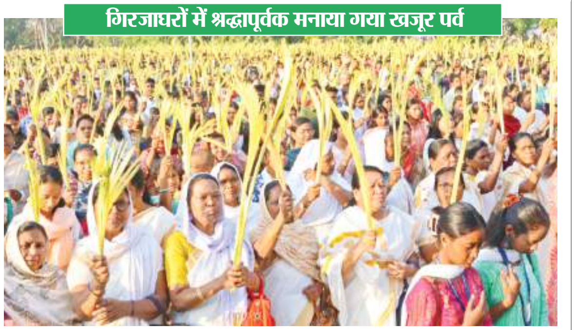
गिरजाघरों में श्रद्धापूर्वक मनाया गया खजूर पर्व

होली के त्योहार का उल्लास हर ओर छाया हुआ है. 24 मार्च की देर शाम को होलिका दहन के बाद कई स्थानों पर 25 मार्च को होली खेली जाएगी तो कहीं 26 मार्च को होली मनेगी. मगर होली की मस्ती हर ओर छाई हुई है. राजधानी रांची में एक होली मिलन समारोह में झूमते युवा.