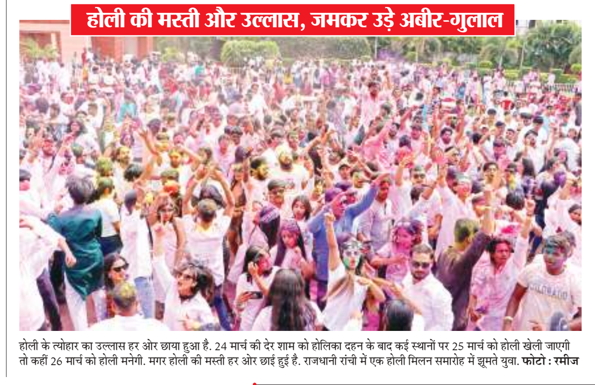
होली की मस्ती और उल्लास, जमकर उड़ें अबीर-गुलाल

होली के त्योहार का उल्लास हर ओर छाया हुआ है. 24 मार्च की देर शाम को होलिका दहन के बाद कई स्थानों पर 25 मार्च को होली खेली जाएगी तो कहीं 26 मार्च को होली मनेगी. मगर होली की मस्ती हर ओर छाई हुई है. राजधानी रांची में एक होली मिलन समारोह में झूमते युवा.