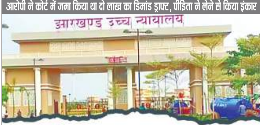
आरोपी ने कोर्ट में जमा किया था दो लाख का डिमांड ड्राफ्ट, पीड़िता ने लेने से किया इंकार