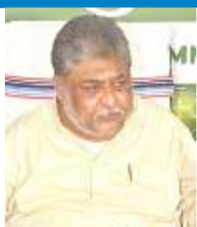
आकाओं से यह सवाल पूछना चाहिए कि हरियाणा में कैसे एक गैर विधायक को किस कानून के तहत मुख्यमंत्री बना दिया गया। क्या