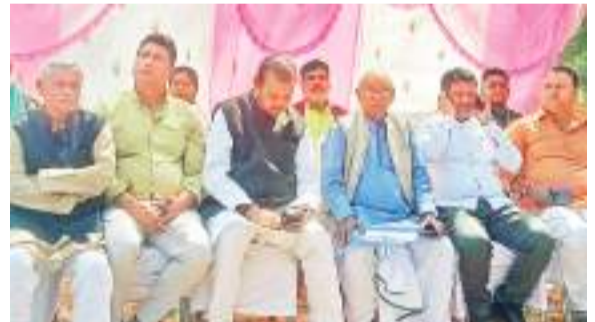
कही गईं। जानकारी की अनुसार, बैठक के दौरान प्रबंधन ने जल्द वेतन देने की बात कही। उनका कहना था

गुरुवार को एचईसी बचाओ मजदूर जन संघर्ष समिति और प्रबंधन के बीच बैठक हुई। प्रबंधन की ओर से एचएमबीपी और एचएमटीपी प्लॉट के जीएम मौजूद थे। जानकारी की अनुसार, प्रबंधन ने कहा की किसी भी ठेका मजदूरों की छंटनी नहीं की जाएगी। नए टेंडर के डॉक्यूमेंट को तैयार किया जा रहा है। जल्द ही टेंडर प्रक्रिया की जाएगी। वहीं अगस्त 2023 को जो टेंडर रद्द किया गया था, इसके बाद के कार्यकाल के बारे में डायरेक्टर से वार्ता करने की बात