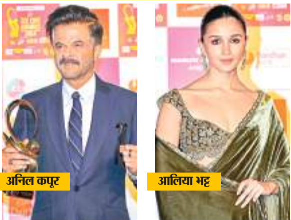
बॉलीवुड अभिनेता अनिल कपूर, बॉलीवुड एक्ट्रेस कृति सेनान और आलिया भट्ट मुंबई में 22वें जी सिने अवार्ड्स 2024 में फोटो सेशन करवाते. इस मौके पर बॉलीवुड के कई कलाकार शामिल हुए.