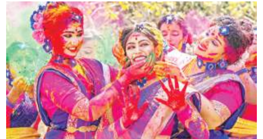
सोमवार को नादिया में होली के त्योहार से पहले रंग और गुलाल से खेलती महिलाएं।