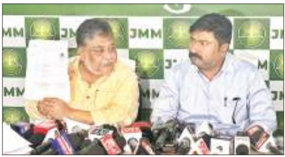
रोकना चाहा तो उन्हें जेल में डाल दिया गया. उन्होंने कहा कि ईडी बताए कि किन-किन कंपनियों पर छापेमारी की गयी. उसके बाद इन कंपनियों द्वारा 375 करोड़ का

उन्होंने इस मौके पर जमीन से संबंधित कागजात भी जारी किया है. कहा कि ईडी का पूरा खेल झारखंड के जल, जंगल, जमीन पर कब्जा करने के लिए है. इसे हेमंत सोरेन ने